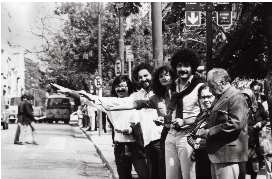
Fig. 2: fotografía integrantes de “Córdoba va” (Plaza San Martín, sobre la calle 27 de abril)