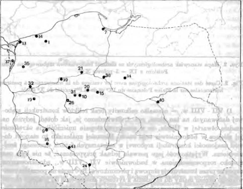
Ryc. 3. Mapa stanowisk archeologicznych ze śladami budownictwa zrębowego na Niżu Polskim z 2 połowy X w.

Natomiast w strefie południowo-wschodniej, podobnie jak w poprzednim okresie, brak jest jak dotąd pewnie interpretowanych relikwów konstrukcji