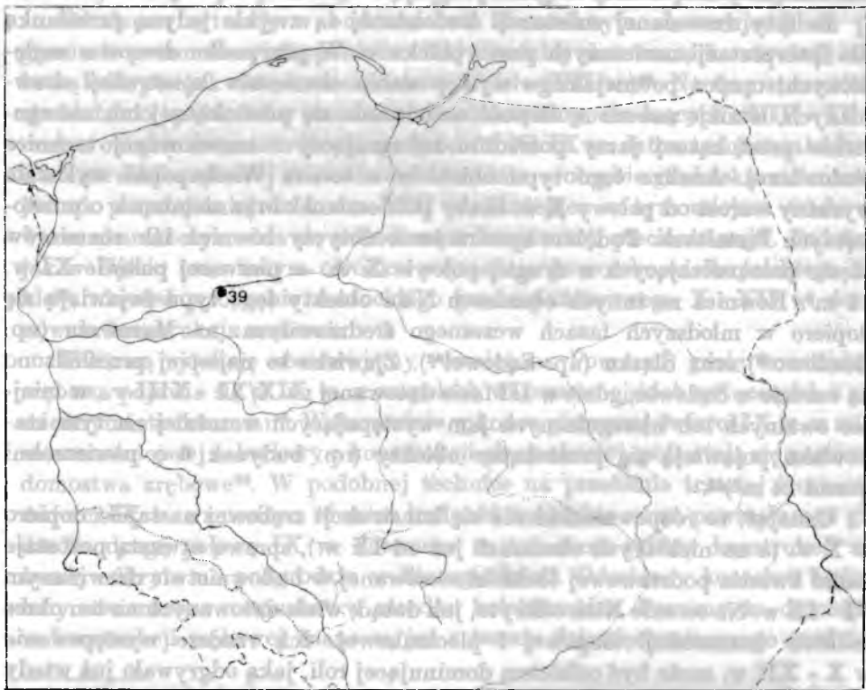
Ryc. 1. Mapa stanowisk archeologicznych ze śladami budownictwa zrębowego na Niziu Polskim z VII - VIII w., linią kropkowaną zaznaczono południową granicę Niziu Polskiego, numeracja stanowisk na mapie zgodna z załączonym wykazem, dotyczy ryc. 1 - 4

Biorąc pod uwagę pewne chronologiczne prawidłowości pojawiania się w materiałach archeologicznych konstrukcji zrębowej w różnych częściach Niziu Polskiego, można podjąć próbę przedstawienia etapów jej rozpowszechniania się na omawianym obszarze: