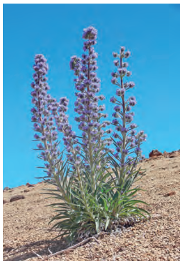
Abb. 9: Echium auberianum : blühende Pflanze auf Bimsstein, Las Cañadas de Teide, Teneriffa.

Pflanzen an ihrem natürlichen Standort viele Jahre benötigen, bevor sie gross genug sind, um zu blühen. Monokarpe Arten investieren während der einmaligen Reproduktion alle verfügbaren Ressourcen aus den Wurzeln, dem Stamm und den Blättern zur Bildung von Samen, was den Tod des Individuums nach sich zieht. Dafür aber bilden die Riesenstauden sehr viel mehr Samen als verwandte, mehrfach blühenden Arten. Das kann bei unvorhersehbar variablen Umweltbedingungen ein Vorteil sein, unter der Bedingung, dass mit dem zunehmendem Aufwand, der für die Samenproduktion betrieben wird, die Fitness zunimmt, also relativ mehr Nachkommen erfolgreich sind. Gattungen, in denen krautige Rosettenpflanzen mit unverzweigten Sprossen vorkommen, sind dafür prädestiniert, monokarpe Riesenstauden auszubilden. Die hohe Keimlingsmortalität bei unwirtlichen Lebensbedingungen, wie z.B. in Gebirgshalbwüsten, wird bei monokarpen Rosettenbäumen kompensiert durch die riesige Zahl einmalig produzierter Samen.