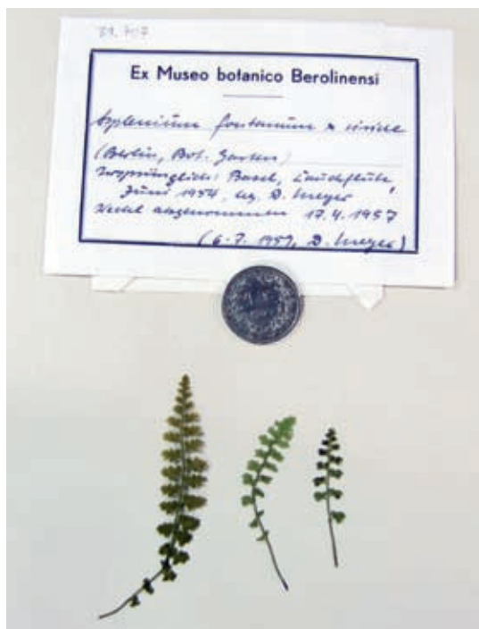
Abb. 3: Herbarbogen von Asplenium fontanum × A. viride . Ein Exemplar dieses äusserst seltenen Bastards wurde an der Lauchfluh bei Eptingen gesammelt und im Botanischen Garten von Berlin kultiviert.

wurde die Ordnung weitgehend so belassen, wie sie beim Beginn der Arbeiten angetroffen wurde. Typenbelege sind im Herbar im Museum.BL keine vorhanden. Als grösste Seltenheit verdient der Bastard Asplenium fontanum × A. viride von der Lauchfluh bei Eptingen Erwähnung (Abb. 3). Eine einzelne Pflanze wurde dort 1954 entnommen und in mehreren Publikationen erwähnt (MEYER 1957, 1962, HESS et al. 1976). Es scheint sich um den einzigen Fund dieses Bastards aus der Schweiz zu handeln, möglicherweise sogar um den einzigen aus Mitteleuropa. Unsere Blätter stammen allerdings nicht vom Originalstandort, sondern von Pflanzen, die im Botanischen Garten in Berlin weiter kultiviert worden waren.