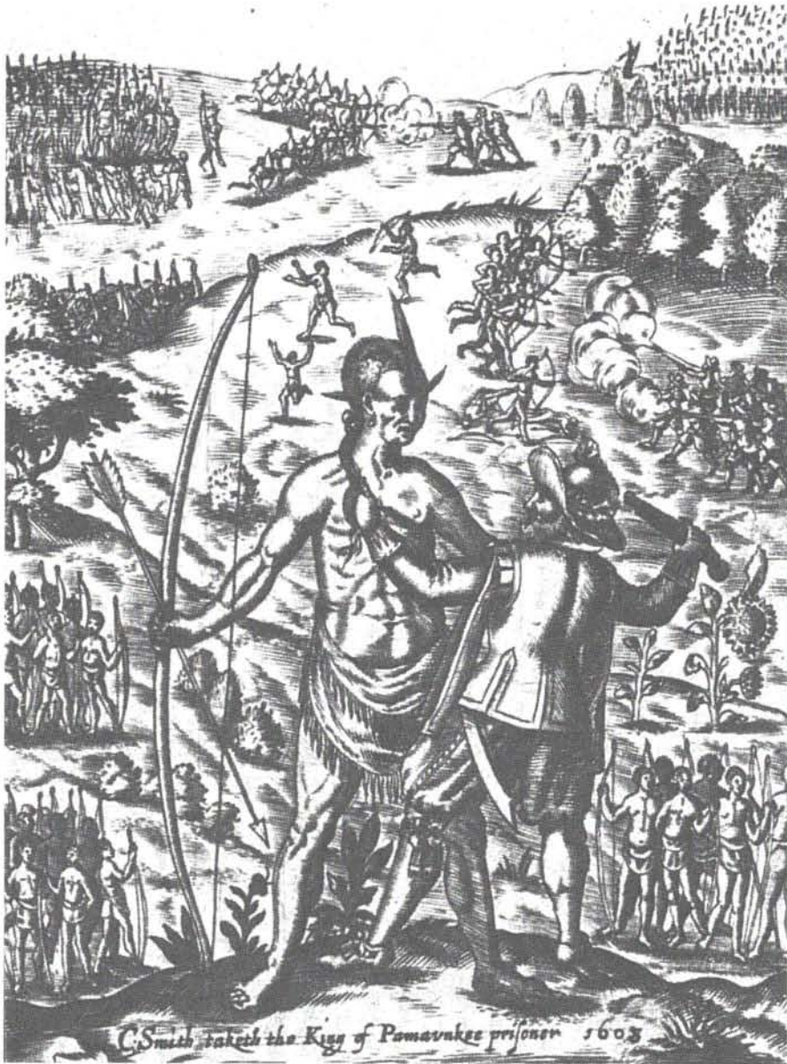
Abb. 2: C. Smith taketh the King of Pamunkey prisoner 1608, Ausschnitt in: John Smith, The Generall Historie of Virginia, New-England, and the Summer Isles , 1624, Complete Works Bd. 2, 99.