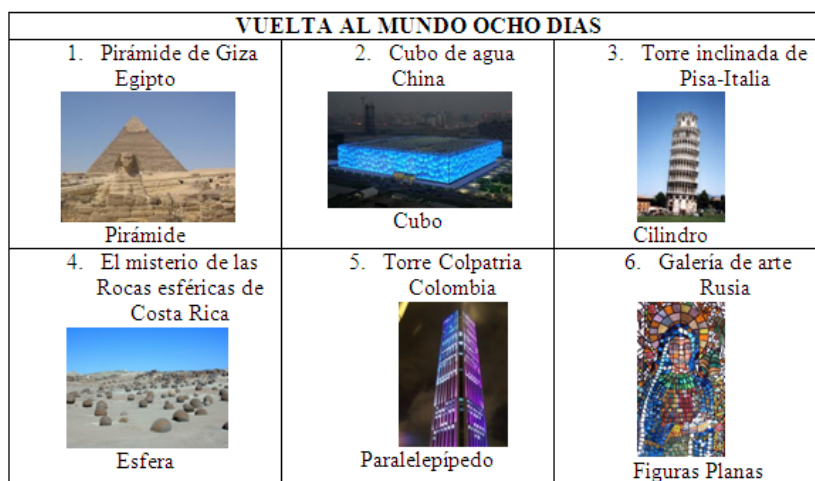
Figura 3: Países visitados en los viajes al mundo geométrico

El reto de lograr construir una secuencia didáctica enfocada a niños de segundo de primaria, donde prevalece el uso de recursos didácticos tanto tangibles como gráfico-textuales desde una situación fundamental se convierte en una experiencia fascinante e inolvidable para los niños, ya que se emergen en lo que los maestros llamaron “ viaje alrededor del mundo geométrico en ocho días ”. Ésta situación trataba de crear en los estudiantes la idea de un viaje alrededor del mundo donde se conocerían nuevas y fascinantes construcciones, además de lugares, costumbres y países diferentes. En cada uno de los países en los que se viajó debería aprenderse algo nuevo referente a la geometría, pues la idea de los maestros-practicantes era mostrarles construcciones en diferentes países asociadas a algunos sólidos geométricos para que finalmente desarrollaran la capacidad de descomponer los sólidos trabajados en sus propiedades bidimensionales, y desde allí envolverlos y trabajar sobre sus propiedades y características.