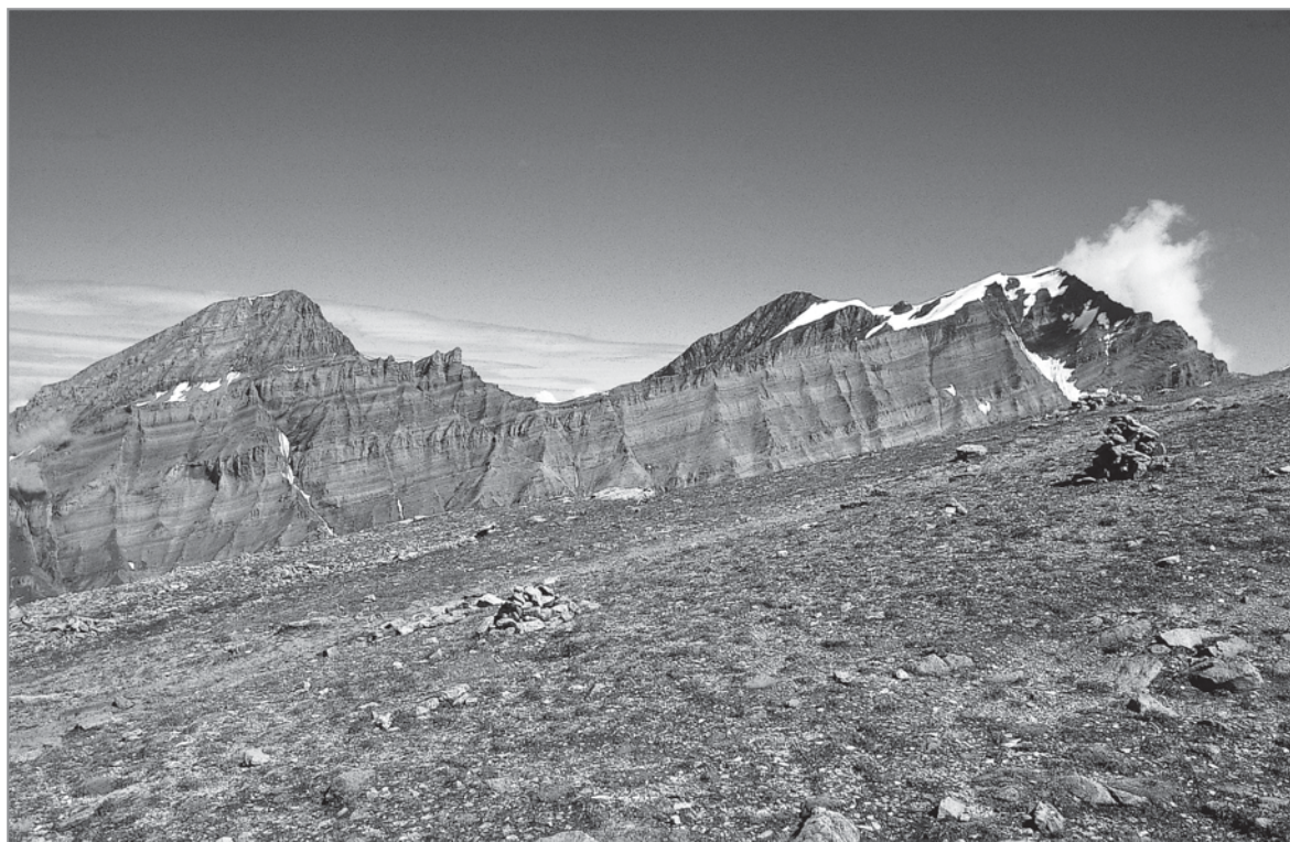
FIGURE 4 – La face ouest du Torrenthorn couverte essentiellement de plantes en coussinets au milieu de cailloux. A l'arrière plan, le Rinderhorn, l'Altels et le Balmhorn.

c'est un sommet nettement moins parcouru que les précédents. Avec 1800-2000 mm, les précipitations annuelles montrent des valeurs intermédiaires aux autres sommets (UTTINGER 1967). Les deux faces sont bien différentes: des gros blocs sur une pente de 30° au nord-est (fig. 5), et des rochers fixes au sud-ouest, avec une pente difficile d'accès entre 40 et 60°. La stabilité des rochers au sommet comme sur la face sud-ouest permet le développement de fragments de pelouses. Cependant, les plantes sont le plus souvent dispersées dans les microniches les plus favorables. Dans son travail consacré à la flore du Valsorey, GUYOT (1920) donne une liste des espèces rencontrées au-dessus de 3000 m. Etant donné l'importance de la surface considérée et les difficultés d'accès au sud-ouest, nous n'avons inventorié en détail lors de notre passage le 29 juillet 2003 que les dix derniers mètres du sommet. Un nouveau carré permanent (40 m 2 ) a été disposé sur la face nord-est près du sommet.