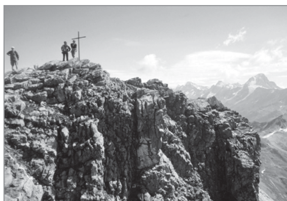
FIGURE 3 – (à droite) Le sommet du Torrenthorn et les falaises de la face sud. – PHOTOS PASCAL VITTOZ

espèces très rares sont toujours oubliées), il est important d'avoir des indications, mêmes grossières, de l'abondance respective des espèces. En plus, de telles estimations permettent un suivi plus fin des changements intervenus (ou futurs) sur le sommet. L'échelle à cinq niveaux de GRABHERR et al. (2001) a été utilisée: r! – l'espèce est très rare, un ou deux individus; r – rare; s – (comme scattered) dispersée, peu abondante; c – commune, fréquente; d – dominante. Des répartitions très hétérogènes peuvent être indiquées par une double valeur, complétée par un l , comme localement (par ex. r-lc – rare, mais localement abondante). Pour les espèces très rares, localement plus abondantes ou avec une répartition limitée à un secteur du sommet, l'estimation du recouvrement était complétée par des indications de localisation (face où elle est présente, altitude maximale par exemple). Ces données ne sont pas publiées ici, mais sont à disposition des intéressés auprès du premier auteur.