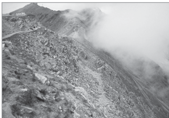
FIGURE 2 – (à gauche) La face sud du Gornergrat, un mélange de rochers, de fragments de pelouses et de plantes saxicoles. La part des pelouses augmente dans la partie basse, hors de la surface considérée dans cette étude.