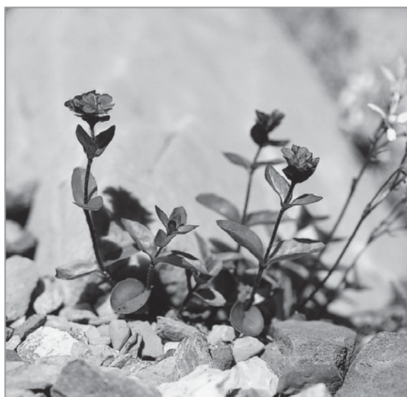
FIGURE 6 – Véronique des Alpes ( Veronica alpina ).