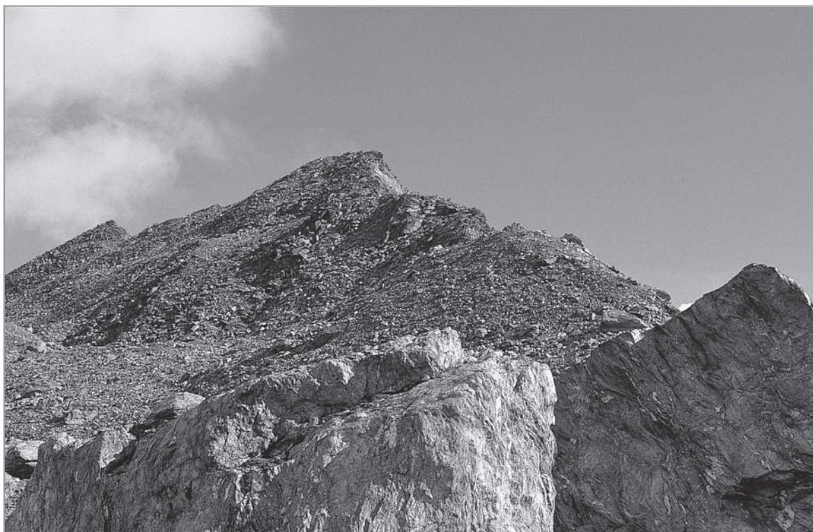
FIGURE 5 – Le Beaufort depuis le nord-est.