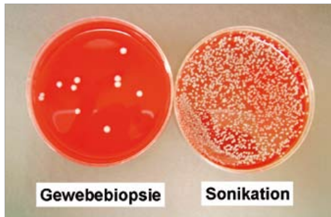
Abb 2: Vergleich der Kultur des Gewebebiopsie und der Flüssigkeit nach der Sonikation (Sonikat)

Sonikation von explantierten Prothesen: Durch Sonikation (Ultraschall) können Mikroorganismen von der Oberfläche des infizierten Implantats entfernt werden (Abb. 2). Vor der Sonikation wird Flüssigkeit eingefügt, damit die Ultraschallwellen die ganze Implantatoberfläche erfassen. Die nach der Sonikation entstandene Flüssigkeit (das Sonikat) wird für Kulturen angesetzt und kann für andere Methoden (zum Beispiel PCR) verwendet werden. Somit ist im Fall einer Entfernung des Implantats (oder dessen mobiler Teile) eine Diagnostik am Ort der Infektion möglich. Mittels der Sonikation können bis 10.000-mal mehr Bakterien als mit Gewebeproben nachgewiesen werden (79% vs. 61%, p < 0,001 , Spezifität von 99%). 3 Damit können Mischinfektionen und unterschiedliche Bakterien-Morphotypen besser nachgewiesen werden. Die Sensitivität ist insbesondere bei Patienten mit vorangegangener Antibiotikatherapie verbessert, weil die im Biofilm geschützten Bakterien besser überleben. Auch Teile der Prothese (z.B. mobile Teile aus Polyethylen oder einzelne Schrauben) können mit dieser Methode analysiert werden. Das Implantat wird aseptisch im Operationssaal aus dem Körper entfernt und im sterilen Behälter ins Mikrobiologielabor transportiert. Nach Zusatz von Ringerlösung wird das Implantat kräftig geschüttelt und für 1 Minute dem Ultraschall