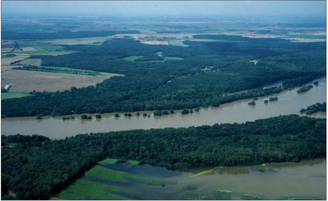
Abb. 9: Der Steckby-Lödderitzer Forst beim Hochwasser 2002.

aktive Klimaschutzpolitik die negativen sozialen und wirtschaftlichen Folgen von Hochwässern vermeiden oder mindestens vermindern helfen.