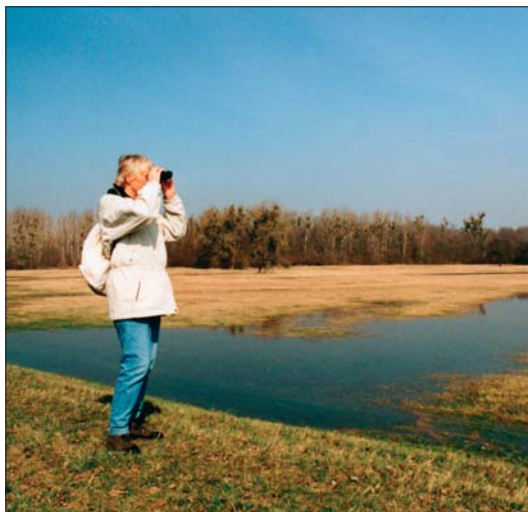
Abb. 5: Naturbeobachtungen.

gen, erhielt am gleichen Tag ebenfalls den Status Biosphärenreservat.