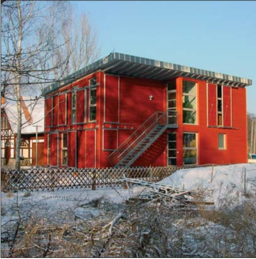
Abb. 12: Der Neubau für die Schutzgebietsverwaltung.

durch die Übernahme von Forstpersonal eine feste Naturwacht, bestehend aus vier Mitarbeitern, installiert. Einhergehend mit der Vergrößerung des Biosphärenreservates erfolgte schließlich im Jahr 2001 deren Aufstockung mit weiterem Personal aus der Forstverwaltung sowie aus vier eingegliederten Naturschutzstationen (Zeitzer Forst, Untere Havel, Elbe-Dübener Heide und Fläming), was zu einem großen Zuwachs bei der inhaltlichen und personellen Entwicklung führte. Heute sind 14 Naturwachtmitarbeiter für die Flusslandschaft des Biosphärenreservates tätig. Darüber hinaus sind weitere 16 Mitarbeiter in der Landschafts- und Biotoppflege aktiv. Das Aufgabenspektrum ist sehr vielseitig und reicht von praktischen Maßnahmen über die Begleitung von Forschungsprojekten und die Schutzgebietsbetreuung bis hin zur Öffentlichkeitsarbeit.