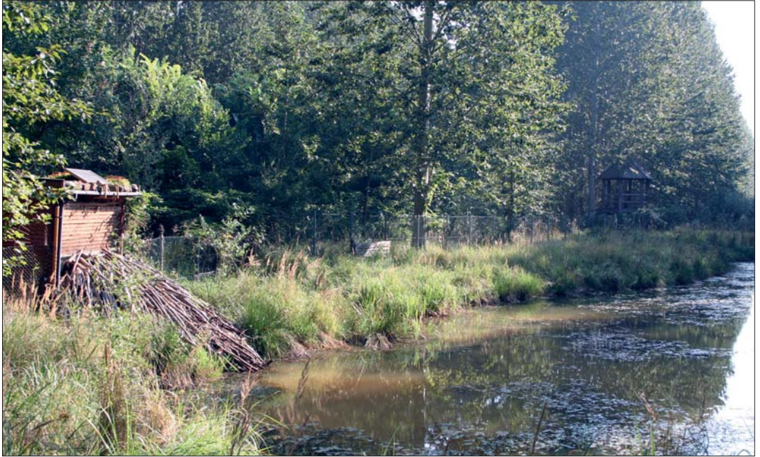
Abb. 15: Die Biber-Freianlage mit dem Kunstbau am Kapenschlösschen.

schutz und Wasserwirtschaft und der Kommunen beim Hochwasserschutz. National bedeutsame Projekte zu Deichrückverlegungen, wie z. B. im Oberluch Roßlau, am Sieglitzer Berg bei Vockerode und im Lödderitzer Forst sind maßgeblich durch das Biosphärenreservat initiiert worden. Sie stellen eine wesentliche, moderne Ergänzung zu notwendigen technischen Lösungen im Hochwasserschutz dar. Letztere konnten in vielen Fällen (leider nicht in allen) mit herausragenden ingenieurtechnischen Lösungen an Natur und Landschaft angepasst werden (vgl. PUHLMANN 2003, PUHLMANN & JÄHRLING 2003).