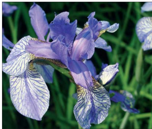
Abb. 8: Sibirische Schwertlilie.

das Biosphärenreservat in der Region zu verankern.