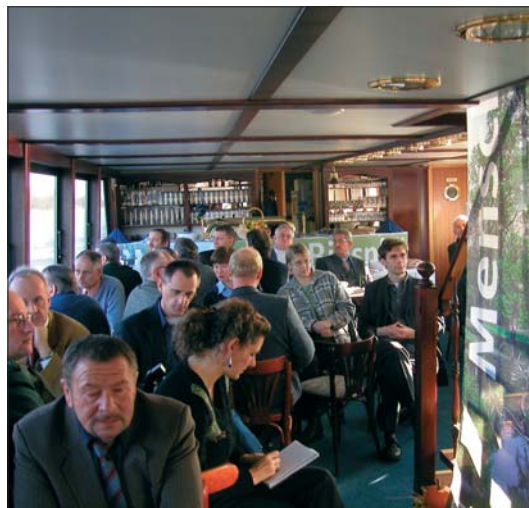
Abb 2: Jubiläums-Schiffahrt am 24.11.2004 bei Aken.

Mit der am 02.12.2004 abgehaltenen historischen Fachtagung bestand die seltene Gelegenheit, Ruhe und Zeit zur Reflexion des Bisherigen und zum Ausblick auf Künftiges aus beruflichem Munde zu finden. Es war erfreulich, dass sich namhafte und zum Teil schon seit langem im verdienten Ruhestand befindliche Zeitzeugen für die Vorträge gewinnen ließen. Die Teilnehmer und Teilnehmerinnen dieser Tagung führte großes persönliches und fachliches Interesse zusammen. Die einzigartige Atmosphäre dieser Tagung, die so wohl nicht wiederholbar sein wird, war ein würdiger Abschluss des besonderen Jahres 2004 im Biosphärenreservat.