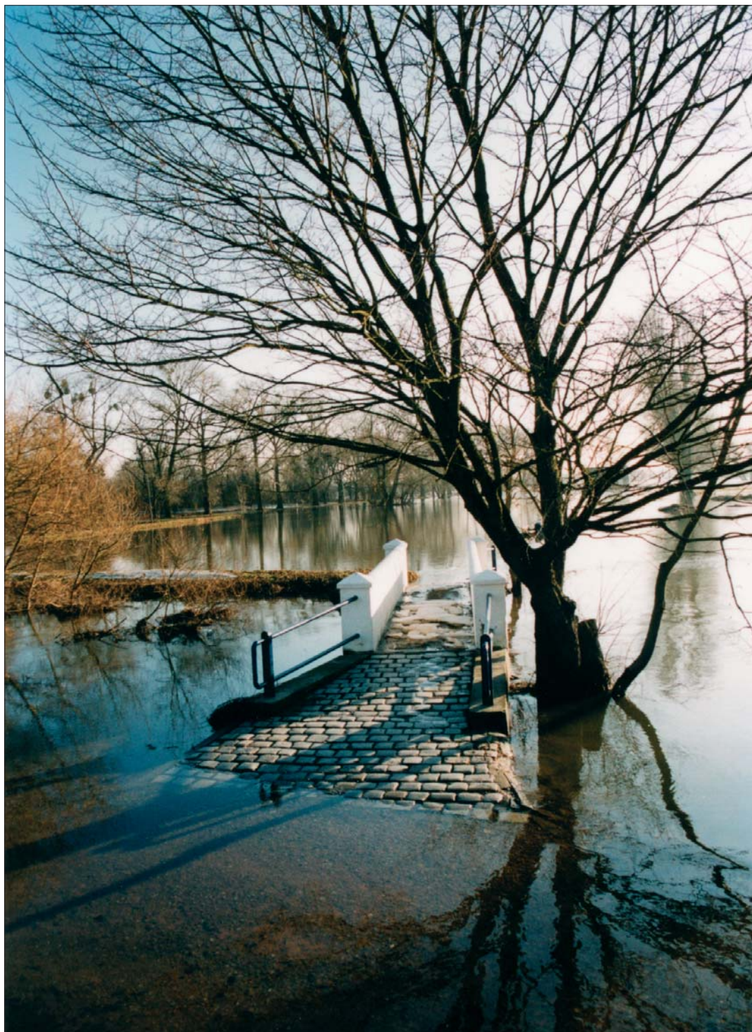
Abb. 18: Weiße Brücke am internationalen Elberadweg Wittenberg–Wörlitz im Januar 2003.