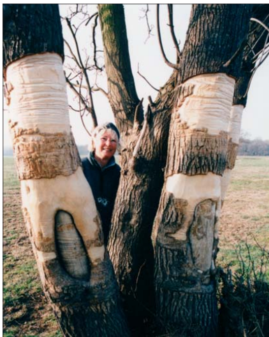
Abb. 14: „Eismarken“ vom Winterhochwasser 2003 an Weiden bei Wörlitz.

Entwicklung der Elbe und ihrer Auen durch die Internationale Kommission zum Schutz der Elbe (IKSE 2000), zu ökologischen und sozioökonomischen Auswirkungen einer auenverträglichen Landnutzung auf Naturschutz, Landwirtschaft und Tourismus (WYCISK 2003) und zur Problematik der Altauenreaktivierung durch Rückdeichung (HAFERKORN 1999).