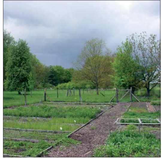
Abb. 13: Der 2001 eingerichtete Schutzgarten für gefährdete Pflanzenarten.

Eine der Wurzeln für die Entwicklung des Biosphärenreservates, der Biberschutz, spielt bis in die Gegenwart eine wichtige Rolle. Seit 1973 werden wissenschaftlich fundierte Wiederansiedlungsprojekte mit Elbebibern aus Sachsen-Anhalt unterstützt. Zunächst durch die Biologische Station Steckby realisiert, werden diese heute durch die Reservatsverwaltung in Zusammenarbeit mit dem Institut für Zoologie der Martin-Luther-Universität Halle-Wittenberg umgesetzt. Bis 2005 wurden ca. 460 Elbebiber in Deutschland (z.B. in Mecklen-