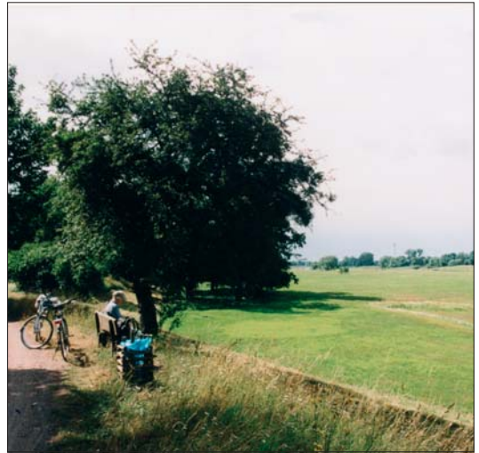
Abb. 6: Radwanderungen.

Ich freue mich, dass ich heute mit Ihnen diesen lohnenden Streifzug entlang des größten zu-