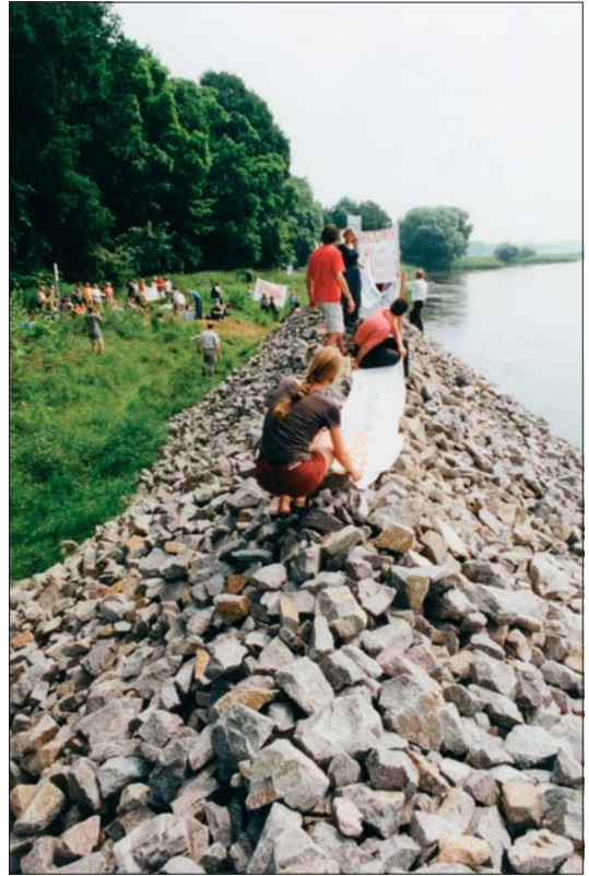
Abb. 17: Unterhaltung oder Flusssaubau? Streit zwischen engagierten Bürgern und der Wasserstraßenverwaltung.

Die Reservatsverwaltung versteht sich als aktiver Teil und Akteur im Prozess und Projekt UNESCO-Biosphärenreservat. Zunächst als unselbstständig nachgeordnete Einrichtung des Umweltministeriums von Sachsen-Anhalt (1991 bis 2000), später als selbstständige nachgeordnete Einrichtung des Ministeriums für Landwirtschaft und Umwelt (2001 bis 2003) bzw. des Regierungspräsidiums Halle (2003) und danach des Landesverwaltungsamtes Sachsen-Anhalt sind die Großschutzgebiete nunmehr seit November 2004 ein integraler Bestandteil des Landesverwaltungsamtes Sachsen-Anhalt innerhalb der Abteilung Landwirtschaft und Umwelt, im Referat Großschutzgebiete.