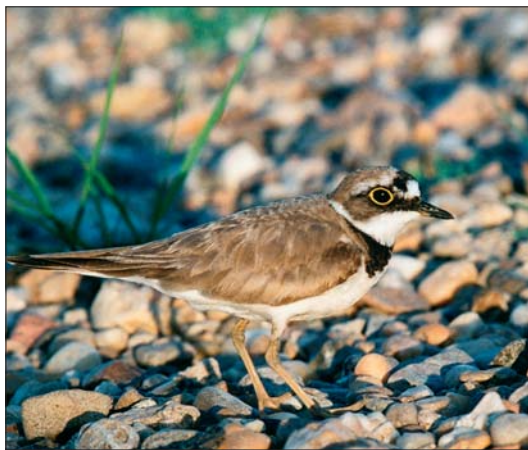
Abb. 7: Flußregenpfeifer an der Elbe.