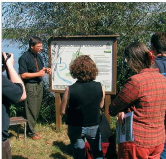
Abb. 1: Gespräche während der Pressereise 2004.