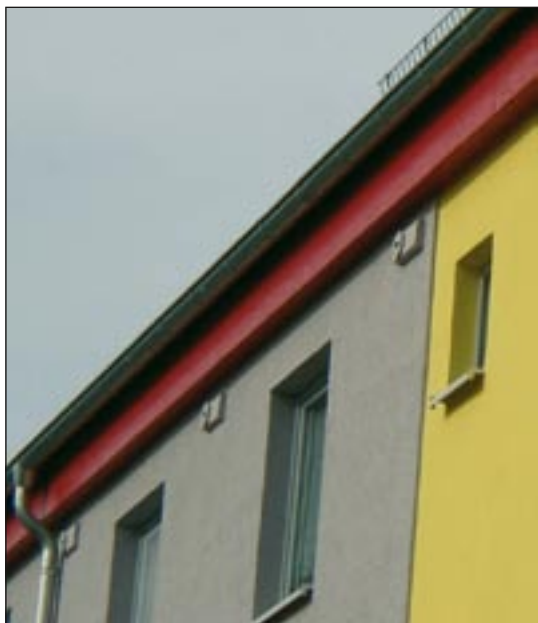
Abb. 4: Mauerseglernisthilfen an der Außenfassade saniertter Wohngebäude in der Heidestraße.

gen Anlaufschwierigkeiten findet sie inzwischen bei allen Beteiligten Akzeptanz. Allein durch das größte Dessauer Wohnungsunternehmen, die Dessauer Wohnungsbaugesellschaft mbH (DWG), wurden seither 230 Mauersegler-Nisthilfen als Ersatzleistungen geschaffen. Dem stehen Verluste in Höhe von etwa 150 Brutplätzen gegenüber. Beim Vorhandensein von Öffnungen im Drempegeschoss von Plattenbauten werden angepasste Nistkästen dahinter angebracht. Wo dies nicht möglich ist, werden meist handelsübliche witterungsbeständige Kästen aus Pflanzenerbeton unterhalb der Dachtraufe installiert. Auf diese Weise wurden z. B. in der Heidestraße 299 bis 321 allein 40 Mauersegler-Nisthilfen montiert (Abb. 4).