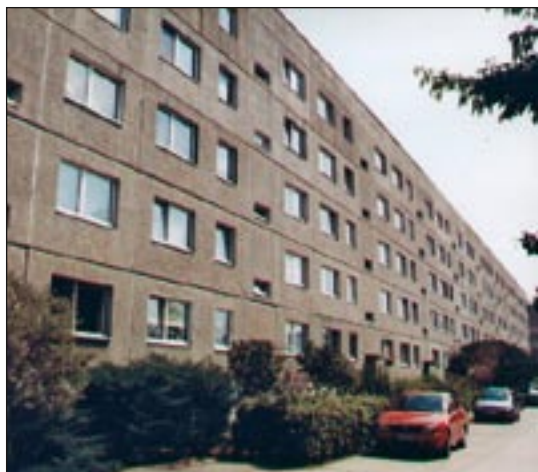
Abb. 2: Rückseite eines Wohnblocks in Dessau-Mitte mit 10-14 BP des Mauerseglers (Nester in verwitterten Plattenfugen).