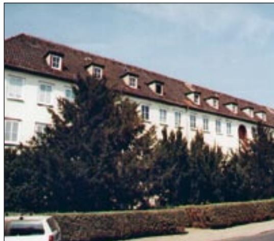
Abb. 3: Wohnblock am Bauhausplatz. In den Dachgauben des Gebäudes brüten 15-19 Paare des Mauerseglers.

Die Kartierung erbrachte im Detail folgende Bestände an gebäudebrütenden Vögeln (Tab. 1 u. 2):