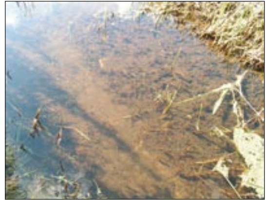
Abb. 4: Infolge der starken Verkrautung findet eine erhöhte Akkumulation von Feinmaterial statt, welches das sandig-kiesige Substrat überlagert (hier nach der Krautung; 30.08.2005).