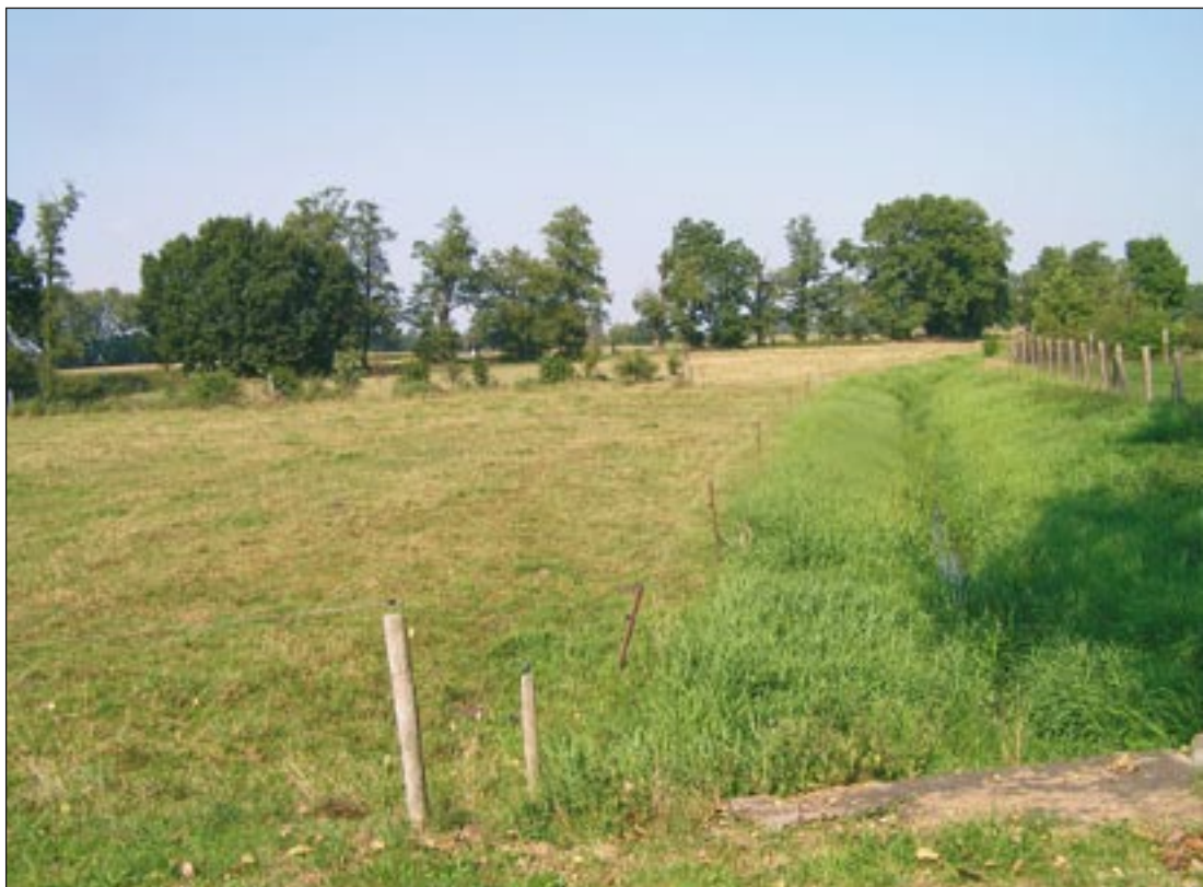
Abb. 1: Die Beeke in Höhe der Ortschaft Wallstawe (Übersichtsaufnahme Transekt 4; 06.09.2005).