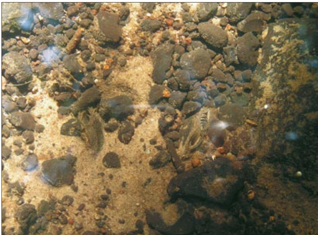
Abb. 6: Das Substrat im Transekt 3 ist sandig bis feinkiesig und bietet damit der Bachmuschel als Lebensraum sehr gute Voraussetzungen (hier mit zwei lebenden Bachmuscheln; (6.9.05).

Populationsgröße kann damit als „gut“ bewertet werden. Diese Bewertungsstufe wird auch dann noch erreicht, wenn man als Ausgangswert die geringste festgestellte Besiedlungsdichte innerhalb eines Transektes annimmt (18 Tiere/25 m). Der Gesamtbestand würde in diesem Fall 1337 Tiere betragen.