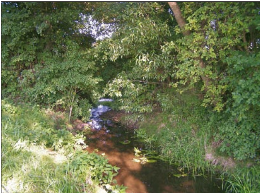
Abb. 5: Übersichtsaufnahme von Transekt 3, welcher die höchste Besiedlungsdichte und beste Altersstruktur aufweist (06.09.2005).

Schüttungsbereich unter die Brücke, wo das Substrat sehr sandig und feinkiesig war. Hier wurden fast alle in Tab. 1 aufgeführten Jungmuscheln nachgewiesen. Bei diesem Transekt handelt es sich um den einzigen untersuchten Abschnitt, in dem keine anderen Großmuscheln feststellbar waren.