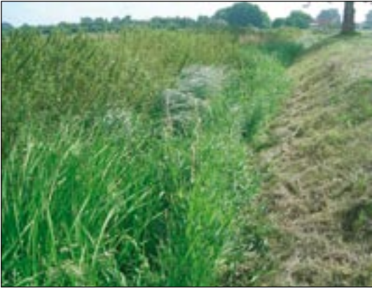
Abb. 3: Westlich Wallstawe wird die Beeke fast vollständig von Röhrichtarten ( Glyceria maxima, Phalaris arundinacea, Carex spec.) eingenommen (hier während der Böschungsmahd, 04.08.2005).