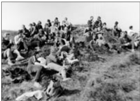
Abb. 16: Arbeitspause beim Pflegeeinsatz Harslebener Berge, den jährlich die GNU-Kreisvorstände organisierten und an dem in der Regel 30 bis 60 freiwillige Helfer teilnahmen (1982).