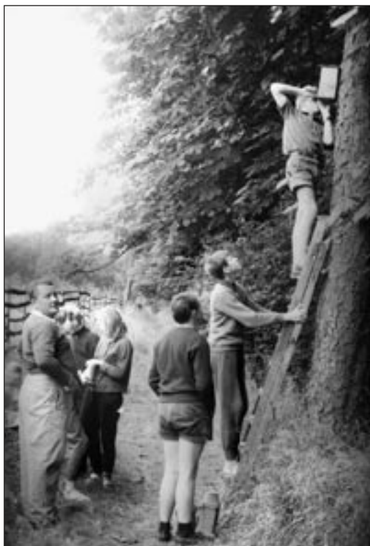
Abb. 19: Nistkontrolle am Naturlehrpfad Hohes Holz durch junge Naturschutzhelfer, etwa 1970 in der Arbeitsgemeinschaft von KNB Günter Natho.

Ein weiteres Feld praktischer und öffentlichkeitswirksamer Naturschutzarbeit war die Gestaltung und Erhaltung von Naturlehrpfaden. Besonders hervorgehoben werden kann unter den in den meisten Kreisen angelegten Lehrpfaden der Naturlehrpfad „Flämingwald“ bei Jeber-Bergfrieden