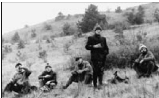
Abb. 11: Pause beim Arbeitseinsatz im NSG „Ziegenberg“ im Dezember 1986 mit Kollegen des Elektromotorenwerkes Wernigerode.

Bruch, im Flechtinger Höhenzug, im Saaletal und 1989 in Neuferchau für den Drömling und im Unstrut-Triasland statt. Gab es anfangs bei den Landschaftstagen noch eine große Offenheit bei der Information über Umweltdaten, war diese Zeit um 1980 vorbei. Durch einen Ministerratsbeschluss aus dem Jahre 1982 galten Umweltdaten als „Vertrauliche Dienstsache“ (VD) oder „Geheime Verschlussache“ (GVS). Sie durften nicht mehr veröffentlicht werden (GENSICHEN 2005). Ein Ziel erreichten die Landschaftstage aber nach wie vor. Der Naturschutz gelangte aus seinem Fachkreis heraus und konnte seine Probleme mit Vertretern aus der Wirtschaft und aus staatlichen Stellen diskutieren, was zu einer Reihe von „kleinen Lösungen“ beim Schutz und bei der Pflege von Gebieten führte.