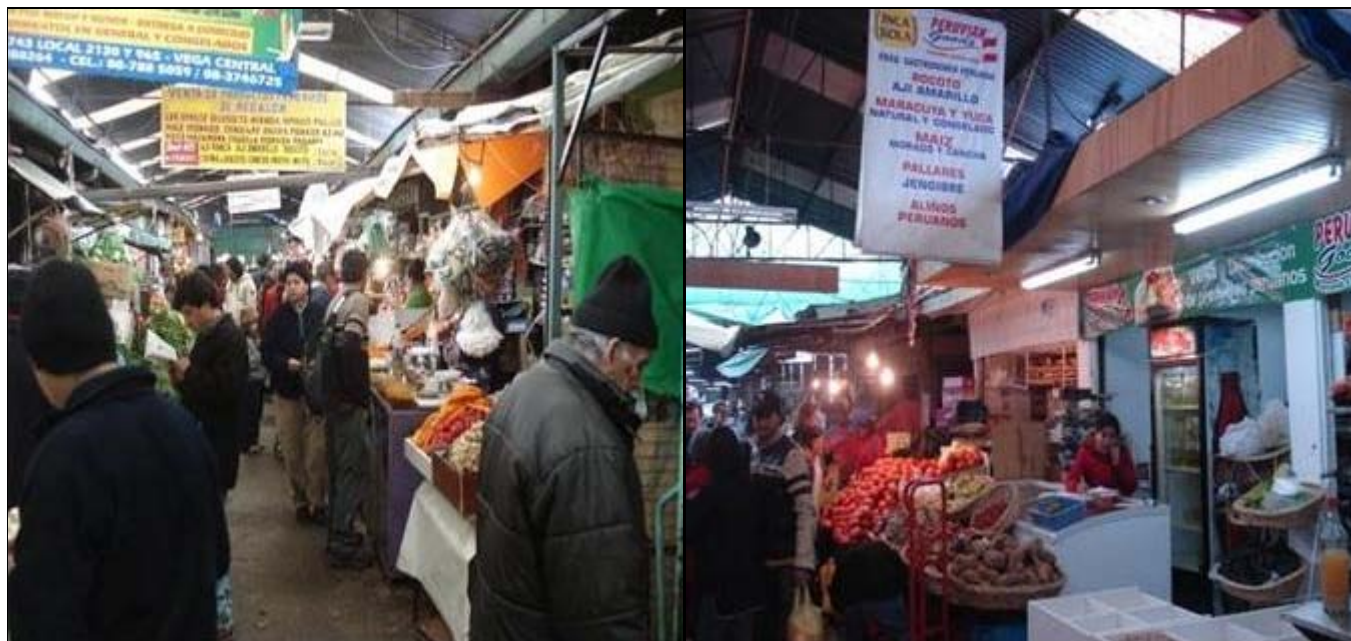
Figuras 3 y 4: Calles internas de la Vega Central. Se observa la instalación de puestos peruanos de productos de alimentación. Santiago de Chile, septiembre de 2007.

comercios regentados por peruanos en el principal mercado de productos de alimentación de la capital, la conocida Vega Central. Se trata de un mercado que combina la venta minorista y al por mayor, donde si bien la abrumadora mayoría de comercios son regentados por nativos, se ha observado cómo en los últimos años de manera gradual se han ido estableciendo puestos de productos de alimentación peruanos. Ya ha mediados de Septiembre de 2007 contabilizamos un número de veinte puestos, copando incluso una de las pequeñas calles internas que estructuran el espacio del mercado.