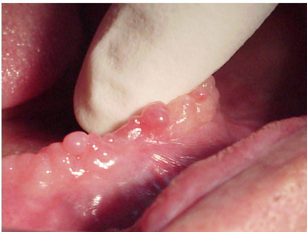
Fig. 11.- Tejido hiper móvil con más de 2 mm. de altura

La aceleración de la resorción en los procesos puede ser más rápida que la capacidad de adaptación del tejido de recubrimiento o mucosa alveolar al periostio, creando mucosa sin soporte óseo y expuesta a la presión de la base de la dentadura provocando su crecimiento o fibrosis que al no tener sostén óseo es de gran movilidad, situación anormal del tejido de recubrimiento de los procesos principalmente en el área de la cresta y que es conocido como tejido hiper móvil, bamboleante o resilente (fig 10,11)