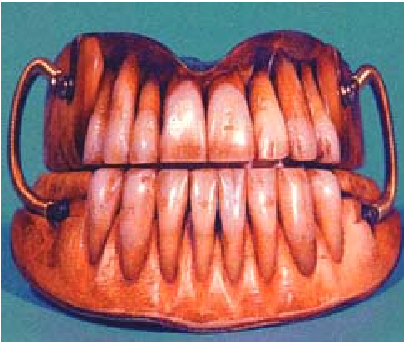
Figura 2.- Una de las Dentaduras artificiales de George Washington: base de madera con dientes humanos (solo anteriores) y resortes insertados

Las dentaduras artificiales nacen con la misma profesión odontológica, los primeros problemas a resolver en la boca no era preservar la dentadura natural sino reponer de alguna manera los dientes que el ser humano se resignaba a perder con los años. Los reportes del siglo XVII y XVIII en materiales usados como bases de estas primitivas prótesis variaban desde los más burdos como el cuero y madera, hasta los más finos de la época como oro, plata, cerámica, estaño. Nicholles (1834) escribió que: “De todas las clases de dientes, los de pasta mineral (de porcelana) son los más objetables; los dientes humanos o de marfil son los mejores y el colmillo de hipopótamo y oro son las mejores bases (fig. 2 y 3).