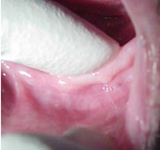
Fig. 13.- Tejido hiper móvil posterior

El tejido hiper móvil se compone de hiperplasia fibrótica de tejido conjuntivo (algunos lo nombran como “Fibroma”), y puede venir acompañado de inflamación aunque en la mayoría de los casos esta ausente (fig 12).