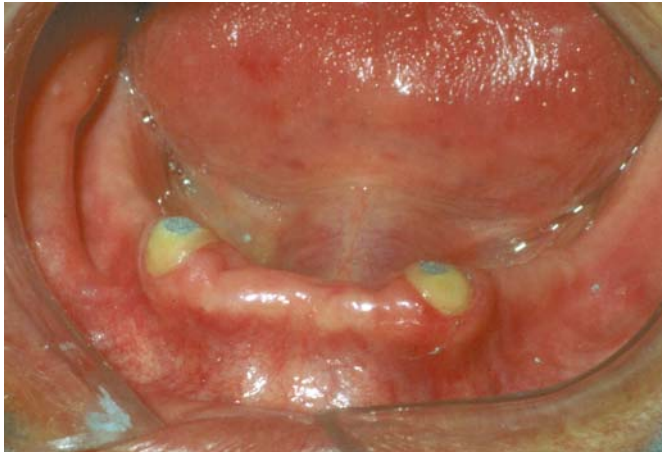
Figura 9.- Sobredentadura clásica con obturación de amalgama