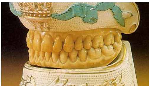
Figura 4.- Bases y dientes de porcelana en una sola pieza superior e inferior

Todo dependía del poder adquisitivo del individuo, y en dichos materiales para bases se engarzaba o incrustaban como mencionamos anteriormente, dientes de humanos, de carnero, tallados en marfil, apareciendo en Francia 1774, los primeros dientes de porcelana con éxito, tanto para coronas, puentes fijos y dentaduras completas (así como bases para dentaduras en porcelana, las cuales estuvieron muy de moda en el siglo XIX) (fig 4) fabricados por N. Dubois de Chemant reconocido como el inventor de la porcelana para uso dental 7 .