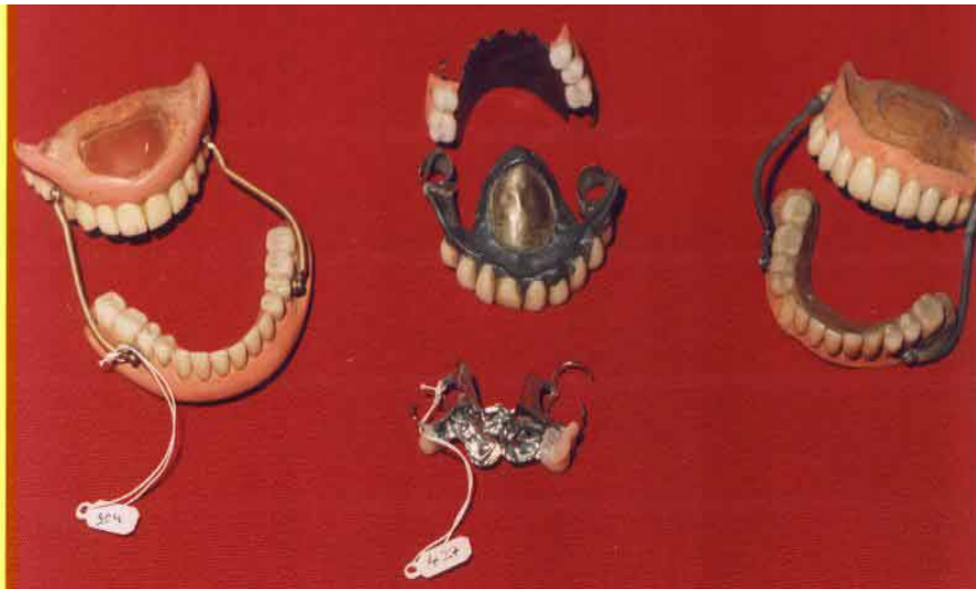
Figura 3.- Dentaduras artificiales con dientes de porcelana y bases de metal y caucho. Observe los primeros intentos de lograr retención por vacío con cámaras de succión

Todo dependía del poder adquisitivo del individuo, y en dichos materiales para bases se engarzaba o incrustaban como mencionamos anteriormente, dientes de humanos, de carnero, tallados en marfil, apareciendo en Francia 1774, los primeros dientes de porcelana con éxito, tanto para coronas, puentes fijos y dentaduras completas (así como bases para dentaduras en porcelana, las cuales estuvieron muy de moda en el siglo XIX) (fig 4) fabricados por N. Dubois de Chemant reconocido como el inventor de la porcelana para uso dental 7 .