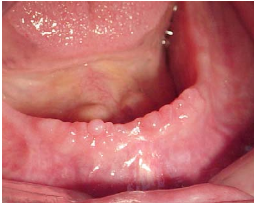
Figura 10.- Tejido hiper móvil con inflamación

La aceleración de la resorción en los procesos puede ser más rápida que la capacidad de adaptación del tejido de recubrimiento o mucosa alveolar al periostio, creando mucosa sin soporte óseo y expuesta a la presión de la base de la dentadura provocando su crecimiento o fibrosis que al no tener sostén óseo es de gran movilidad, situación anormal del tejido de recubrimiento de los procesos principalmente en el área de la cresta y que es conocido como tejido hiper móvil, bamboleante o resilente (fig 10,11)