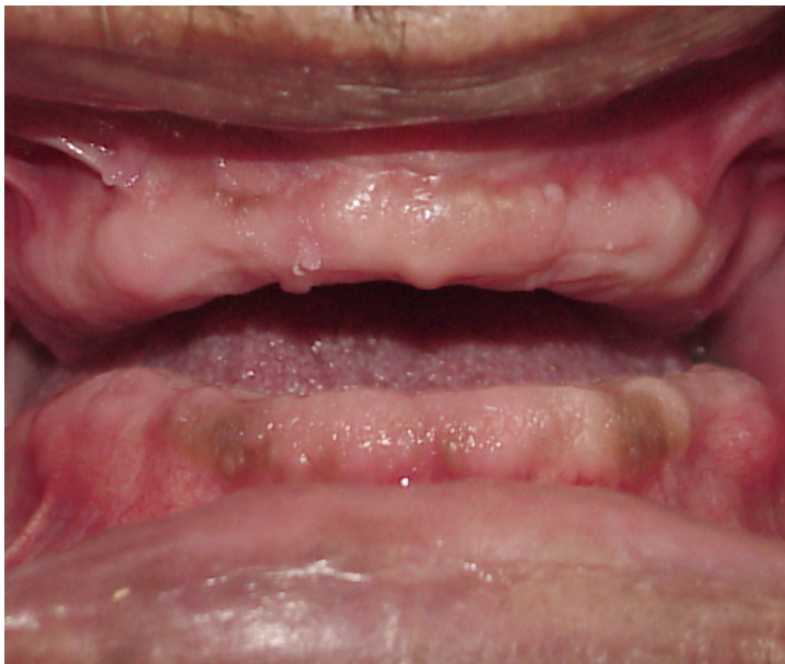
Figura 1.- Condición óptima de los procesos desdentados.

También por aspectos mecánicos como son: la armonía o balance oclusal y la perfecta adaptación de la base de la dentadura a los procesos residuales; este último aspecto es de vital importancia ya que ayuda a que se provoquen los fenómenos físicos anteriores. Los materiales usados históricamente para bases de las dentaduras no han sido los más adecuados y el que actualmente se usa tampoco lo es, pero ha demostrado tener propiedades de mayor capacidad que cualquier otro, como se verá en el siguiente apartado. Para que su función sea aún mejor, también necesita que los procesos residuales tengan un mayor volumen, una densidad ósea que debe ir de “adecuada” a “fuerte” con gran mineralización, una mucosa de recubrimiento sana y por consiguiente fuerte y elástica (Fig 1).