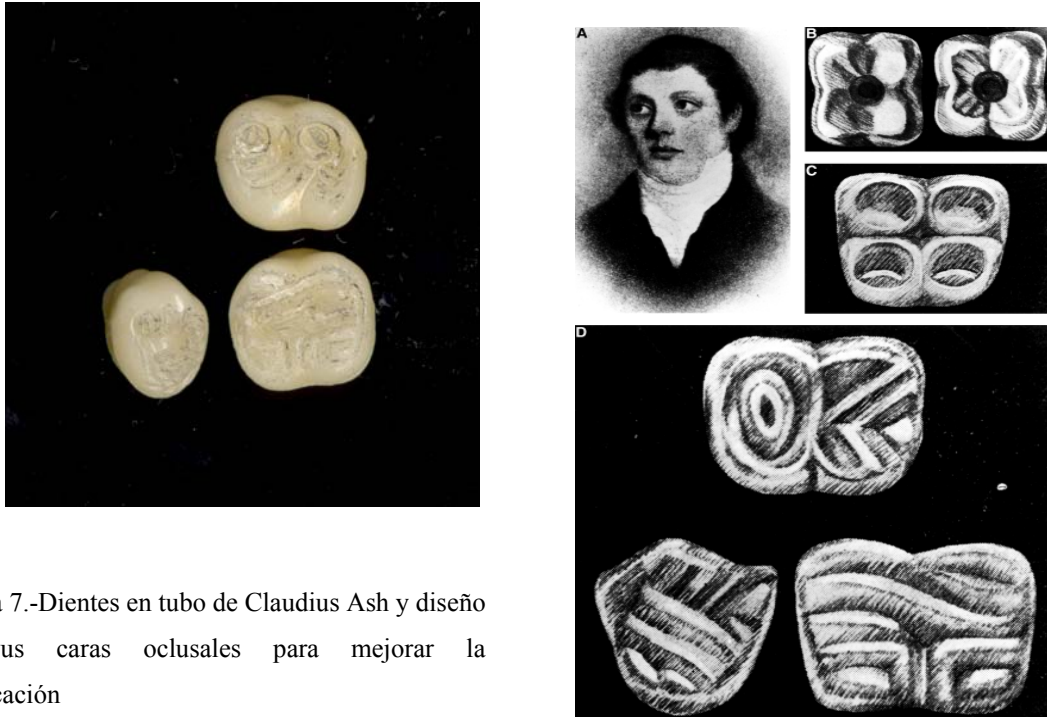
Figura 7.-Dientes en tubo de Claudius Ash y diseño de sus caras oclusales para mejorar la masticación

diferencias ni siquiera de los dientes superiores con los inferiores o del lado derecho e izquierdo tratando solamente de ser racionalmente funcionales.