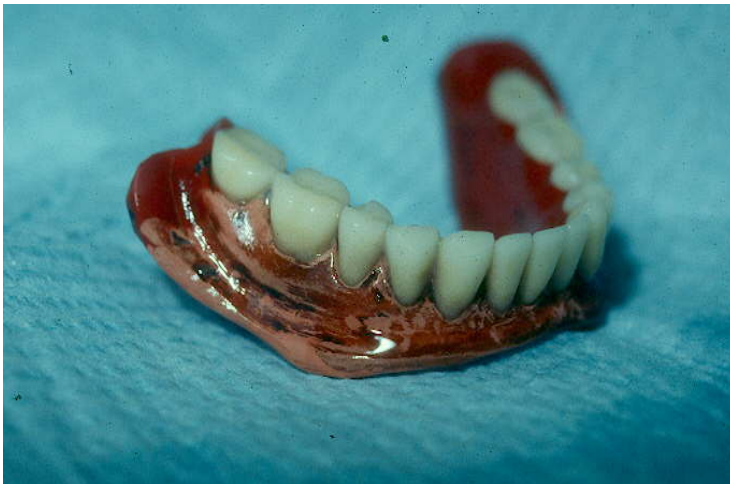
Figura 4. Dentadura inferior con base de Caucho o Vulcanita y dientes de porcelana con 60 años de antigüedad (nótese la pérdida del color extrínseco).

Con respecto a las bases no hubo uniformidad en el material usado en la fabricación de estas para el uso en dentaduras, hasta la aparición del caucho o vulcanita con un método de elaboración de dentaduras completas inventado en Inglaterra por Thomas W. Evans. y patentado por Charles Goodyear Jr. en 1855 en los Estados Unidos. Método que se universalizó rápidamente, pues en la mitad del siglo XIX con la invención de la anestesia, el principal o quizá único tratamiento dental, consistía en la extracción de los dientes y su reposición en forma total o parcial, por lo que la necesidad de materiales de mayor adaptación y menos costosos fue imperante y el costo de la vulcanita era de un tercio de cualquier otro material metálico o cerámico usado para dentaduras en esos años 15-17 (Fig. 5).