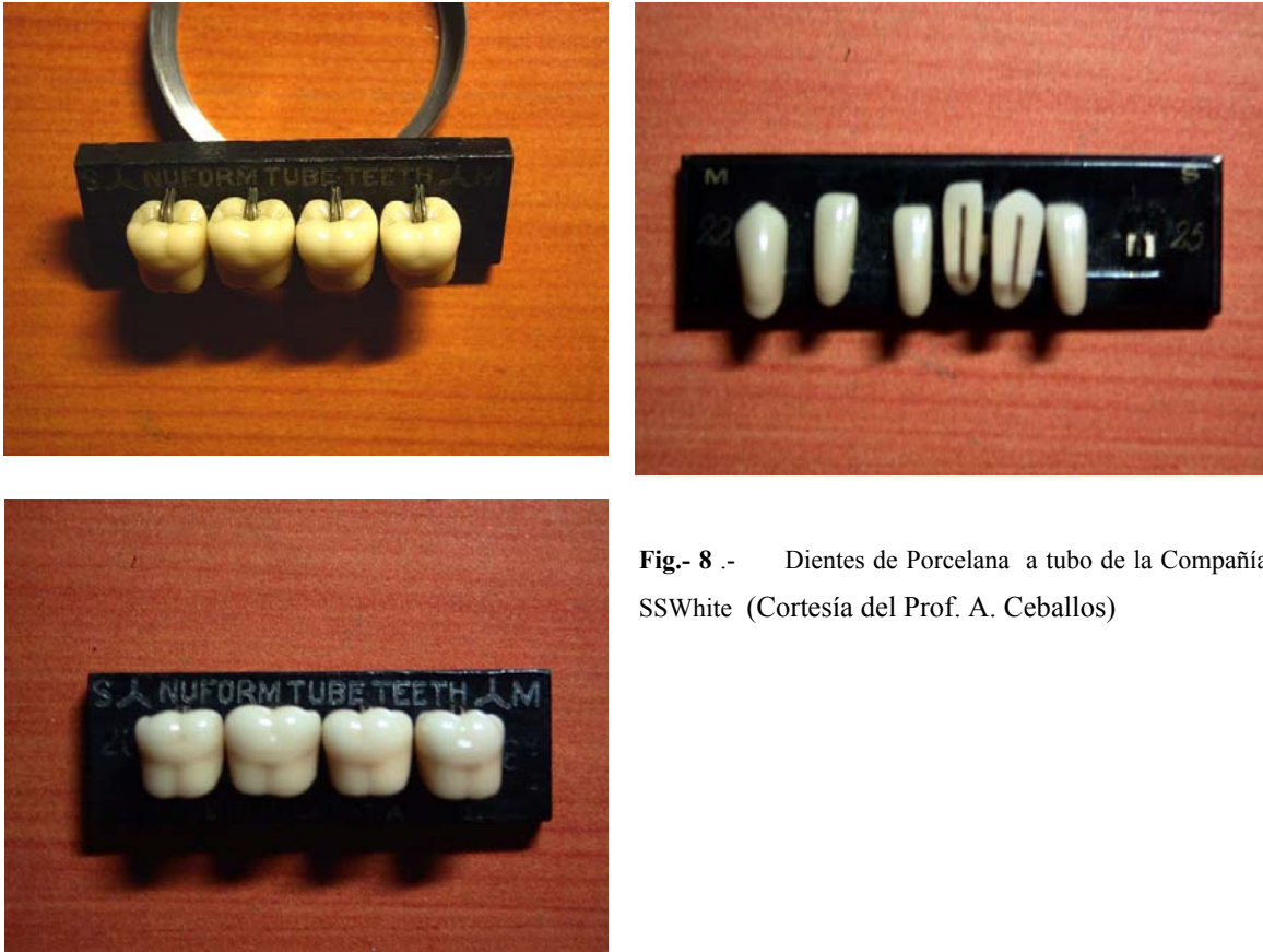
Fig.- 8 .- Dientes de Porcelana a tubo de la Compañía SSWhite

Fue también fundador de la primer revista especializada en odontología, que fue antecesora de la famosa Dental Cosmos que dominó las publicaciones dentales a principios del siglo XX y solo fue desplazada por la revista de la Asociación Dental Americana cuando esta fue fundada.