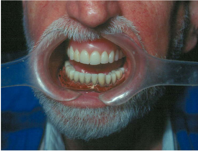
Figura 5.- Combinación de dentaduras con base de Caucho inferior (hecha en 1932), con dientes de porcelana y base de PMMA superior (hecha en 1992) con dientes de acrílico

Su abaratamiento se debió a hechos trágicos y sangrientos, con el asesinato en San Francisco del recaudador principal de la compañía Goodyear perpetrado por un dentista molesto por el pago extra que se cobraba por cada dentadura como derecho de patente, provocando un juicio de liberación de la misma dos años después.