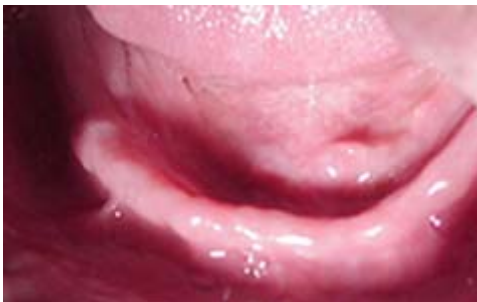
Figura 12.- El tejido hiper móvil puede no ser identificado hasta que se realiza la palpación de la mucosa

En el caso contrario en los pacientes con basta experiencia en prótesis es más fácil identificarlo y actuar en consecuencia con alguna alternativa de tratamiento o técnica de impresión.