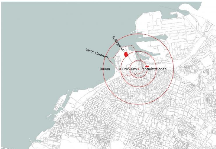
Fullriggarens läge i Västra Hamnen i Malmö. Området ligger 1000 meter från Centralstationen och cirka 300 meter från havet.

Fullriggaren i Malmö är en del av utbyggnadsprojektet i Västra Hamnen där tanken är att skapa en stadsdel med hög standard ur ett hållbarhetsperspektiv kombinerat med ny teknik och innovativa lösningar (Fossum 2010). Byggnationerna av Fullriggaren påbörjades 2009 och skall vara helt klart under 2013 och projektet har tilldelats 23 miljoner kronor av Delegationen för hållbara städer (Malmö stad odat.).