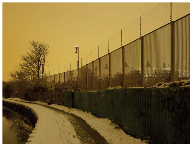
Figura 4 - Amber Alert #2

Este conjunto de normas tiene la particularidad de equiparar expresiones comerciales, religiosas, étnicas y políticas, y considerar que todas representan el mismo tipo de amenaza al Movimiento – y a sus mecanismos de generación de plusvalía. La criminalización sumaria de todas estas formas de expresión, tanto en el interior de la zona olímpica como en sus alrededores, es sin duda unos de los aspectos más extraordinarios de la arquitectura legal olímpica. Entrar en esta zona de excepción olímpica , o incluso acercarse a ella, implica renunciar a derechos básicos, o más exactamente, aceptar que éstos han quedado suspendidos. Es aquí donde la condición biopolítica del estado de excepción emerge más claramente: la producción de una “tierra de nadie legal” es también producción de homines sacri , o seres sin derechos (AGAMBEN, 1999). La analogía formal con el paradigma del “campo” es evidente – y apropiadamente perturbadora. En la siguiente sección se verá cómo la ingeniería legal se relaciona de hecho con una estrategia de militarización del espacio urbano, de modo que el estado de excepción deviene así espa-