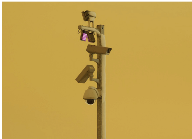
Figura 1 - Amber Alert #1