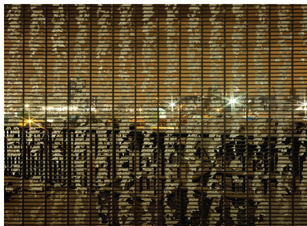
Figura 2 - Amber Alert #6

La sección VIII del mismo documento estipula también que cualquier superávit resultante de la organización de los Juegos ha de ser repartido entre el BOA (20%), la promoción del deporte en el país anfitrión (60%) y el COI (20%). En caso de pérdidas, sin embargo, la responsabilidad cae sobre el gobierno anfitrión. En resumen, las autoridades británicas se han comprometido a reunir nueve mil millones de fondos públicos para la organización de un evento privado de dos mil millones, exento de impuestos y exento de riesgos para sus organizadores. Estas favorables condiciones para las finanzas del Movimiento, culminación de una elaborada obra de ingeniería fiscal, está convenientemente defendida por lo que