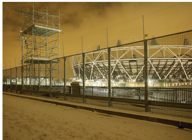
Figura 5 - Amber Alert #7

El totalitarismo moderno puede ser definido, en este sentido, como la instauración, por medio del