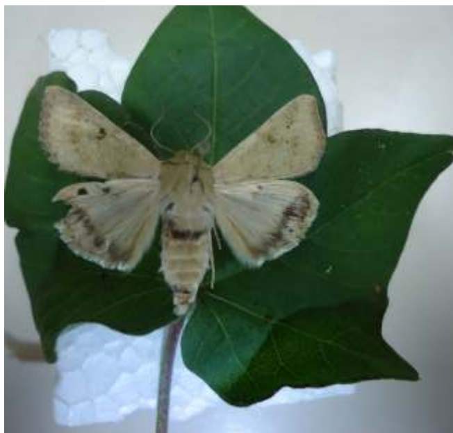
Figura 5. Adulto de Helicoverpa armigera .

comportamento de colonização de H. armigera (FIREMPONG; ZALUCKI, 1991). Cada fêmea, durante o período de oviposição, que é de cerca de 5,3 dias, pode colocar de 2.200 até 3.000 ovos sobre as plantas hospedeiras (NASERI et al., 2011; REED, 1965), o que caracteriza o elevado potencial reprodutivo desta espécie.