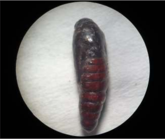
Figura 4. Pupa de Helicoverpa armigera .

As mariposas fêmeas de H. armigera apresentam as asas dianteiras amareladas, enquanto as dos machos são cinza-esverdeadas com uma banda ligeiramente mais escura no terço distal e uma pequena mancha escurecida no centro da asa, em formato de rim. As asas posteriores são mais claras, apresentando uma borda marrom na sua extremidade apical (Figura 5). As fêmeas apresentam longevidade média de 11,7 dias e os machos de 9,2 dias (ALI; CHOUDHURY, 2009). Os adultos de H. armigera são fortemente atraídos por flores que produzem néctar, sendo esse recurso importante na seleção do hospedeiro, o qual também influencia a sua capacidade de oviposição (CUNNINGHAM et al., 1999). Outros compostos secundários (semioquímicos) que são produzidos pelas plantas hospedeiras também influenciam o