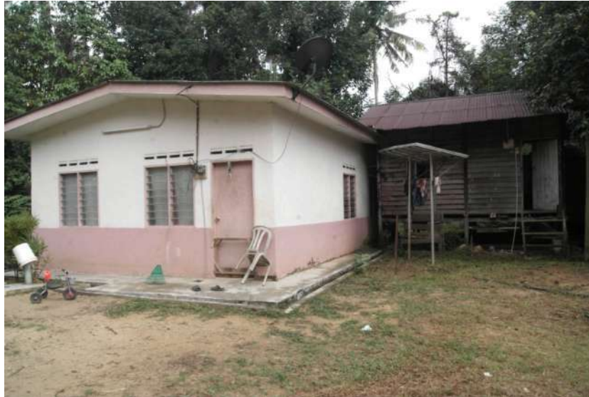
Foto 1. Rumah Yang Dibina Di Bawah Skim Projek Perumahan Rakyat Termiskin (PPRT)

yang dilengkapi dengan kemudahan rumah seperti ruang tamu, bilik tidur, dapur dan tandas (Foto 1).