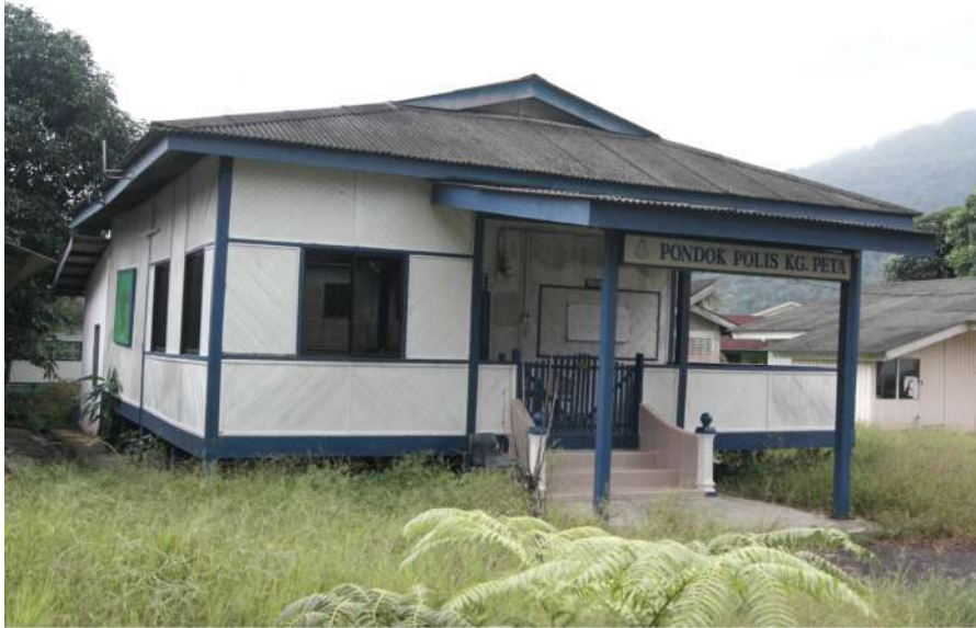
Foto 2. Balai Polis Kampung Peta

dia turut mengajar cara membuat pakaian kulit kayu ini kepada jiran-jiran penduduk setempat. Kulit kayu terap menjadi bahan utama pembuatan. Sepasang pakaian dijual pada harga RM300 di mana baju berharga RM150 dan seluar juga pada harga RM150.