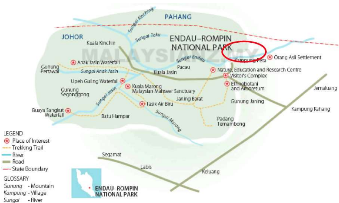
Rajah 1. Kedudukan Kampung Peta

Kampung Peta merupakan salah sebuah kampung Orang Asli yang terletak di daerah Mersing, Johor (Rajah 1). Kampung yang didiami oleh masyarakat Orang Asli etnik Jakun tersebut terletak di pinggir sungai Endau dan berhampiran kawasan Taman Negara Johor Endau-Rompin.