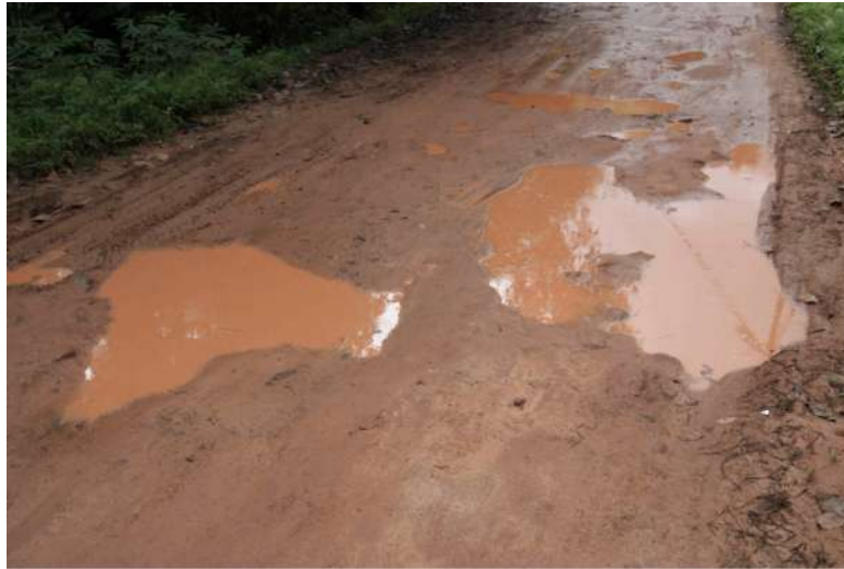
Foto 7. Permukaan Jalan Yang Tidak Rata dan Berlopak

kemudahan hotel serta melaksanakan aktiviti dan program pelestarian. Pihak swasta juga perlu memberi tajaan khususnya sebagai inisiatif bagi mencapai kelestarian seperti penyediaan tapak pelupusan kompos untuk pengunjung dan penduduk tempatan, menyediakan papan petunjuk laluan, atau melabelkan nama spesis pada pokok.