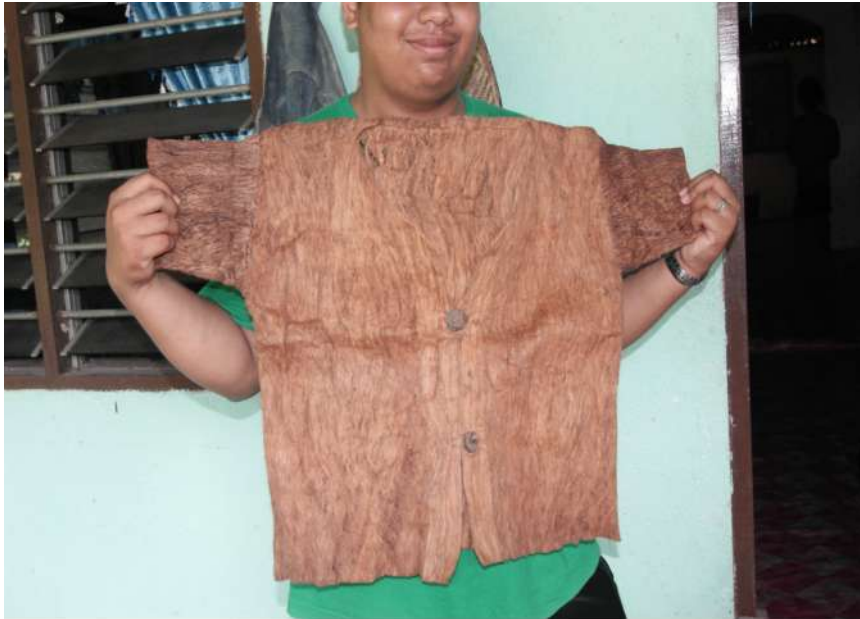
Foto 4. Baju Yang Diperbuat Daripada Kulit Kayu Terap