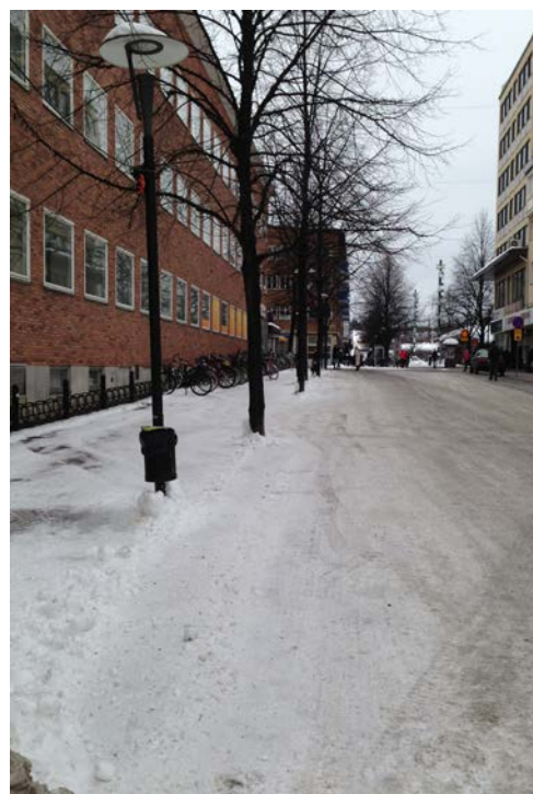
Figur 2. Träd i hårdgjord miljö.

Denna placering av stadsträd är enligt Sjöman & Lagerström (2007) vanligt förekommande. Nackdelen är att utrymmet för stora, breda trädkronor är mycket begränsat av närliggande byggnader och det är svårt att använda växtbäddar utan hårdgjord yta då gång- och cykeltrafikanter måste få plats. För att ge träden en bra etablering i dessa lägen, måste större växtbäddar med skelettjord konstrueras. En skelettjord byggs upp genom 2/3 stenkross och 1/3 växtjord med en hårdgjord yta som läggs på växtbädden. Tyvärr hade det visat sig att dessa växtbäddar måste göras om efter 10-15 år (Sjöman & Lagerström, 2007). Sjöman & Lagerström (2007) menar på att valet av växtslag bör ha ett växtsätt där de utvecklar smala kronor, för att inte bli tvungen att beskära trädet som fördärvar utseendet. Träden ska tåla torka och försämrade näringstillgång med tiden. De hårdgjorda ytorna runt träden gör att dagvattnet kommer att ledas bort och då löv städas bort blir ingen mullbildning möjlig. Att välja träd som inte utvecklar en alltför stor trädkrona gör att de inte behöver lika stort rotsystem, och genom formklippning kan träden klara sig väl på den begränsade växtbädden (Sjöman & Lagerström, 2007).