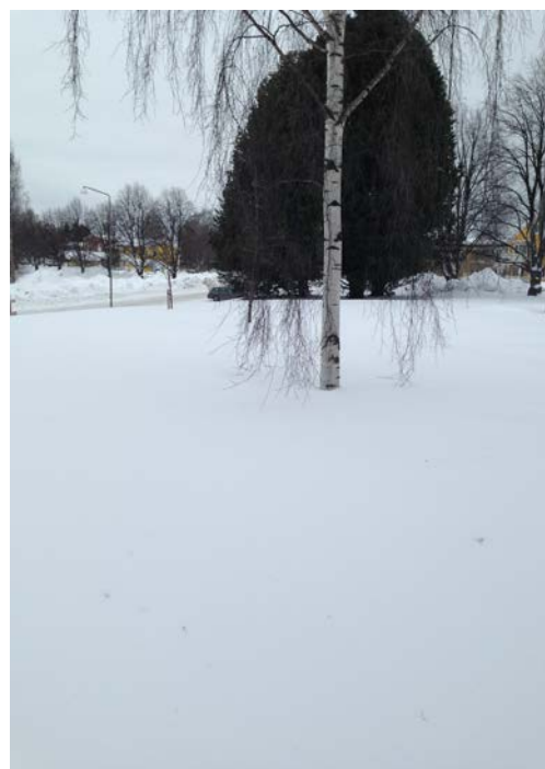
Figur 3. Grönområde.

Dessa områden kan liknas vid vanliga parkmiljöer enligt Sæbø et al (2003). Träden på dessa ställen är inte lika utsatta för alla stressfaktorer som förekommer i de hårdgjorda miljöerna. Dessa träd kan därför uppnå en högre ålder. Stressfaktorer som kan