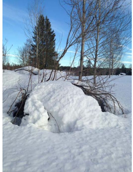
Figur 6. Snötäcke över buske.

Kall snö innebär inget problem då den glider av grenarna. Vid töväder fastnar istället snön och utgör en belastning (Carlsson & Lundberg, 1990, Harris 1983). Särskilt unga träd kan bli allvarligt vanställda av tyngden från tidig blötsnö (Harris, 1983). Ett sätt att förebygga detta är att beskära lignoserna (Sandström, 2003). Trädens kronor bör därför hållas luftiga för att minimera riskerna. Även valet av växtmaterialet kan förhindra fläckningsskador (Nordfjell, 1979). Mindre träd och buskar som blir helt täckta av snö kan skadas på våren då snösmältningen drar med sig grenar som fastnat (Carlsson & Lundberg, 1990). Vid enstaka fall kan det bli aktuellt att binda ihop ömtåligt material, speciellt vid etablering (Nordfjell, 1979). Även undanskottning och avskakning av snö som fortfarande är kall är förebyggande åtgärder (Carlsson & Lundberg, 1990). Då gnagare trivs bra under snön kan följderna bli att de ringbarkar träden, vilket kan ge förödande konsekvenser (Sandström, 2003). Om inte tjäle bildats i marken innan snön faller förvärras gnagskadorna (Carlsson & Lundberg, 1990). Gnagskydd bör användas där problem finns (Sandström, 2003, Carlsson & Lundberg, 1990).