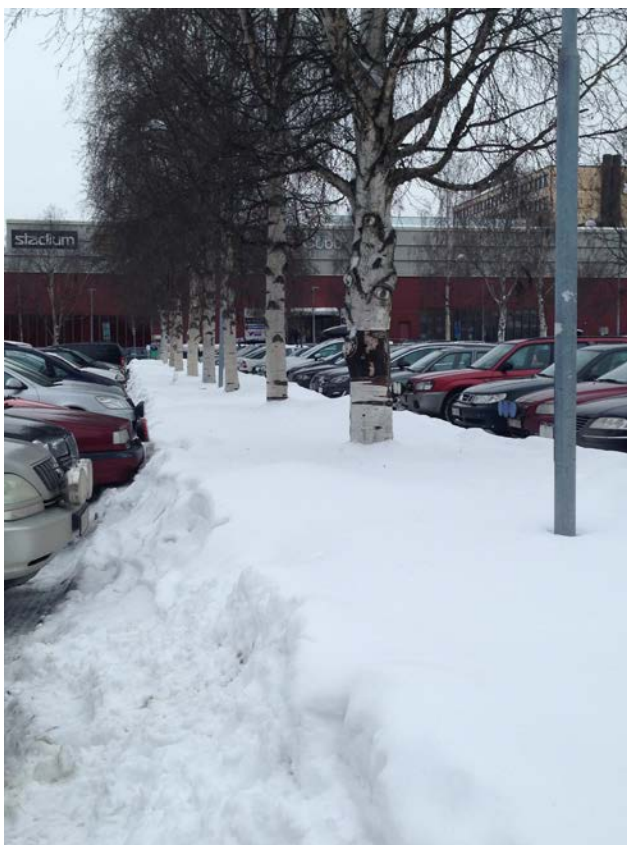
Figur 1. Träd i mittrefug.