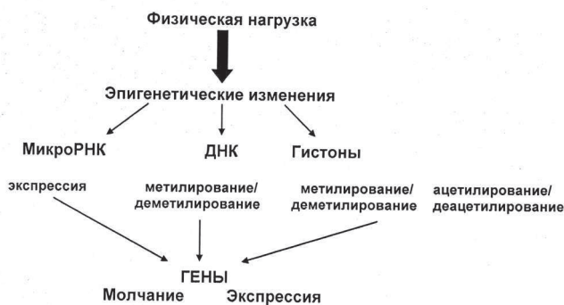
Возможные эпигенетические изменения в мышечной клетке под действием физической нагрузки

В скелетных мышцах тканеспецифическими микроРНК являются miR-1, miR-133a, miR-133b, miR-206, которые получили название миомиРНК. Эти четыре микроРНК принадлежат к семейству miR-1, которое может быть на основе различий специфических последовательностей в структуре молекулы разделено на две группы: miR-1/206 и miR-133a/b. Следует отметить, что микроРНК регулируют основные функции скелетных мышц, такие как миогенез, энергетический метаболизм, синтез белков, гипертрофию и атрофию.