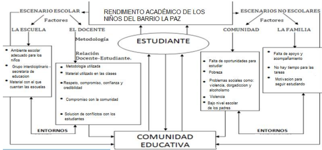
Figura 1. Factores al rendimiento académico de los niños del Barrio la Paz