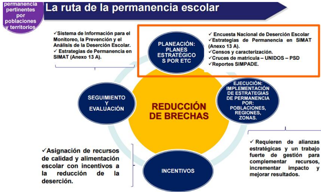
Figura 3. Ruta de la permanencia escolar