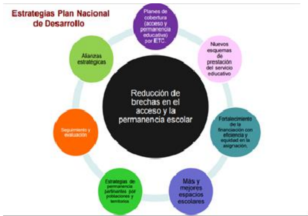
Figura 2. Estrategias Plan Nacional de Desarrollo