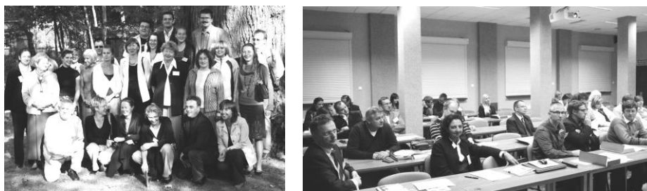
Ryc. 5. Warsztaty z Geografii Turyzmu: w 2007 r. w Rochnie (lewa), w 2016 r. w Spale (prawa).

Warto odnotować aktywność komisji na arenie międzynarodowej: Międzynarodowa Karpacka Konferencja Turystyczna (Kraków, 1985), Sympozjum międzynarodowe pt. Uwarunkowania rozwoju zagranicznej turystyki przyjazdowej w krajach Europy Środkowej i Wschodniej (Wrocław-Borowice, 1990), Sympozjum międzynarodowe pt. Uwarunkowania rozwoju turystyki zagranicznej w Europie Środkowej i Wschodniej (Międzygórze, 1992) oraz zorganizowane z inicjatywy Stanisława Liszewskiego założycielskie spotkanie Grupy Roboczej Geografów Turyzmu Krajów Europy Środkowo-Wschodniej w ramach Komisji Turystyki i Czasu Wolnego Międzynarodowej Unii Geograficznej (Łódź, 1992).