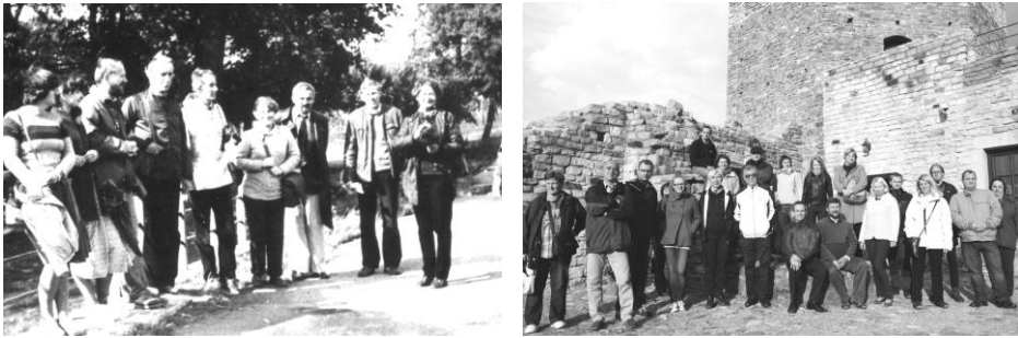
Ryc. 3. Warsztaty z Geografii Turyzmu: w 1984 r. w Łodzi (lewa); w 2013 r. w Inowłodzu (Spała) (prawa).

Doniosłe znaczenie miało zorganizowane w 1980 r. w Krakowie seminarium pt. Praktyczne aspekty badań geografii turystyki , w którym uczestniczyli zarówno przedstawiciele nauki, jak i praktyki (Główny Komitet Turystyki, Główny Urząd Statystyczny, Państwowe Biuro Podróży „Orbis” oraz instytucje działające na szczeblu wojewódzkim i miejskim).