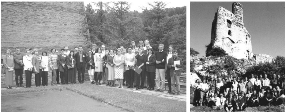
Ryc. 4. Warsztaty z Geografii Turyzmu: w 2001 r. w Malej Moravce (Czechy) (lewa); w 2003 r. pod zamkiem Mirów (Potok Złoty) (prawa).

W 1986 r. komisja dla uczczenia 50-lecia utworzenia Studium Turyzmu Uniwersytetu Jagiellońskiego zorganizowała seminarium, na którym A. Jackowski wygłosił wykład wprowadzający na temat Studium Turyzmu 1936–1939. Ocena działalności dydaktycznej i naukowej (Sprawozdanie.. 1986, 1987, s. 387) . W dniach 18–19 października 1989 r. komisja zorganizowała we Wrocławiu seminarium pt. Ocena atrakcyjności turystycznej krajobrazu Polski (Sprawozdanie... 1989, 1991, s. 131) .