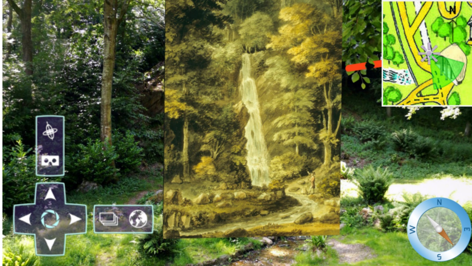
Figura 2 – Screenshot della App in modalità AR (Augmented Reality) alla tappa della cascata. È possibile vedere il dipinto di Bampfylde sovrapposto alla cascata odierna.