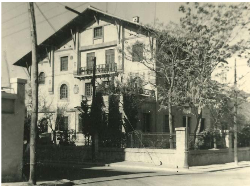
Imagen 1. La Casa del Niño

La Escuela de Fisioterapia, a través de la transmisión de conocimientos teóricos y prácticos, nace con el fin de atender y poder prestar ayuda eficaz a los niños con problemas motores que por nacimiento, enfermedades nerviosas, musculares, accidentes fortuitos, reumatismos, alteraciones en la forma y posición de los huesos, y otras muchas causas origina en ellos defectos en la marcha, deformaciones, atrofias y disminución de las funciones normales del tronco, brazos y piernas 33 . Así, las patologías más frecuentes eran las derivadas de la poliomielitis, parálisis cerebral infantil y espina bífida (Toledo, 2010, p. 416).