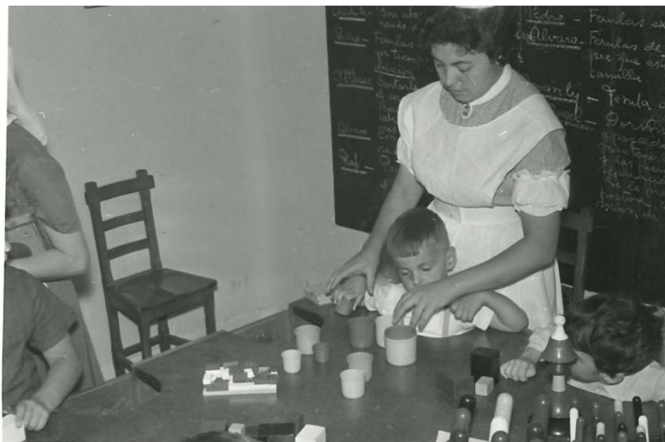
Imagen 10. Departamento de Terapia Ocupacional

riencia de terapeutas tituladas. Dependiendo de la clase de parálisis, se realizaban ejercicios activos y de coordinación, y según la edad, para los más pequeños, juegos educativos; para los adolescentes, iniciación profesional; y para los adultos, toda clase de adaptaciones, dirigidas a la adquisición de la mayor independencia dentro de las actividades de la vida diaria (Véase imagen 10).