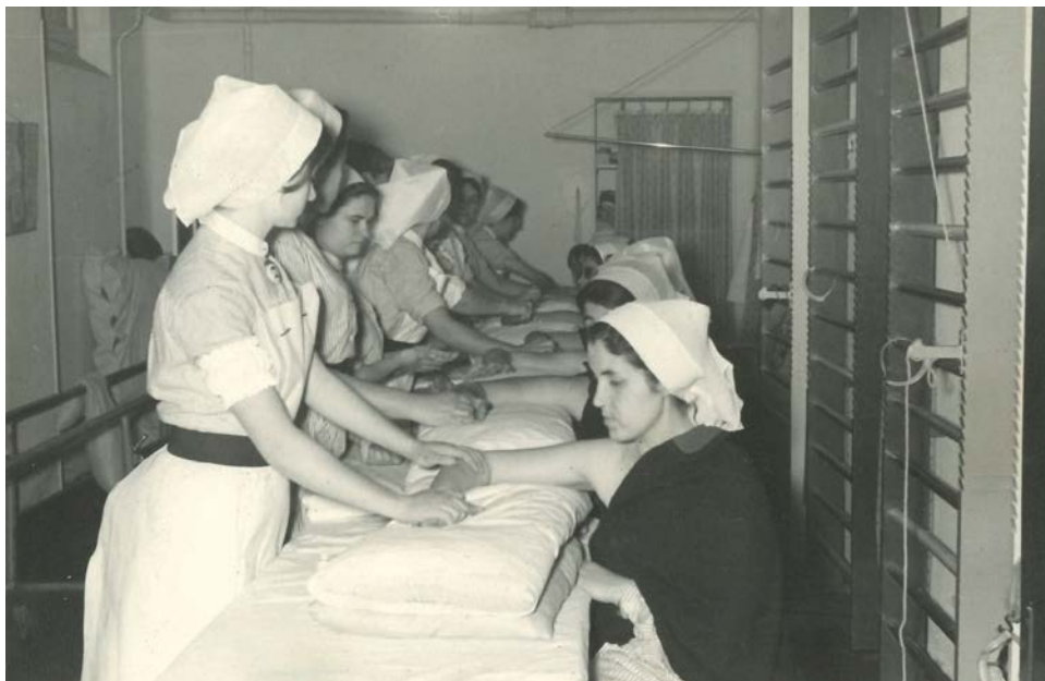
Imagen 4. Alumnas en clases prácticas