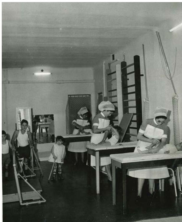
Imagen 6. Sala de Fisioterapia