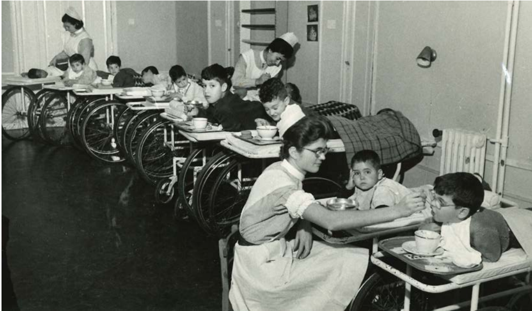
Imagen 11. Comedor de la zona residencial del centro