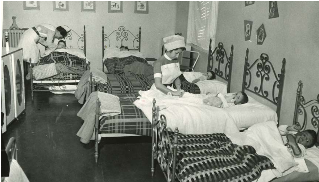
Imagen 12. Dormitorio de la residencia