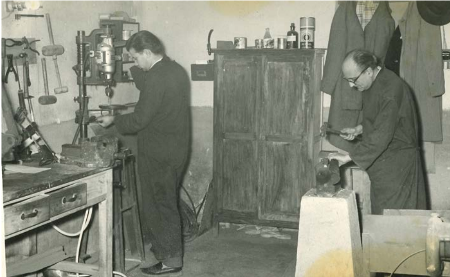
Imagen 8. Taller de prótesis

la caída del pie, férulas de Saint-Germain, alimentador para el brazo, bicicleta, raquetas, portalápices, férulas de mano, taconeras, cubiertos, suspensiones, poleas y todo aquello, más o menos sofisticado, que contribuyera a dar más autonomía al inválido 41 (Véase imágenes 8 y 9).