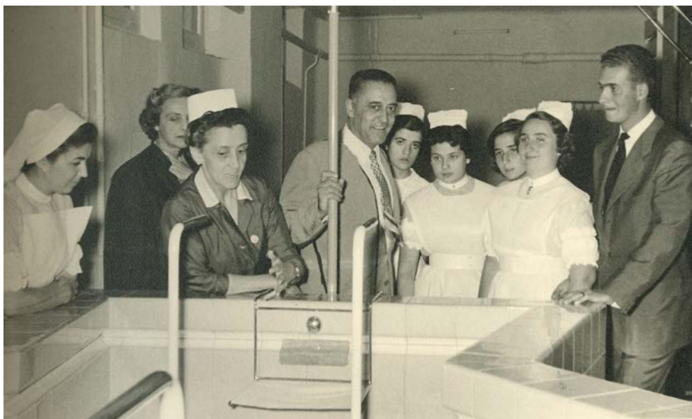
Imagen 13. Visita del Infante D. Juan de Borbón, en compañía de su hermana la infanta D a Margarita, alumna de puericultura de Salus Infirmorum