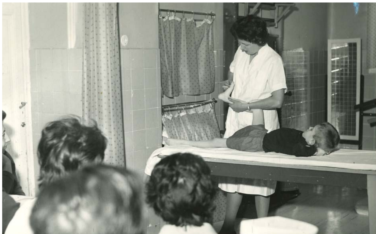
Imagen 7. Alumnas recibiendo una clase práctica