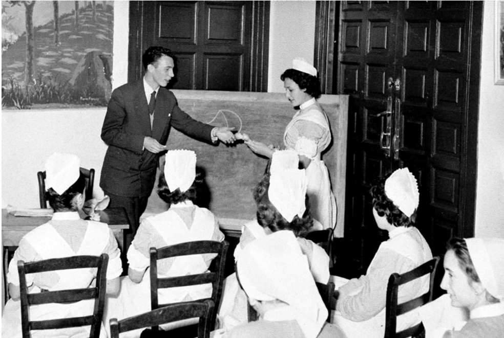
Imagen 3. Alumnas durante el desarrollo de una clase teórica