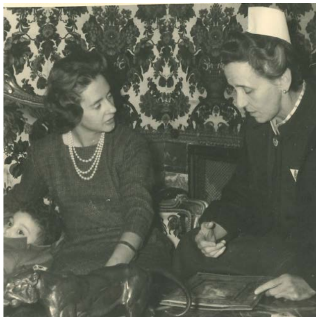
Imagen 14. Visita de la Reina Fabiola