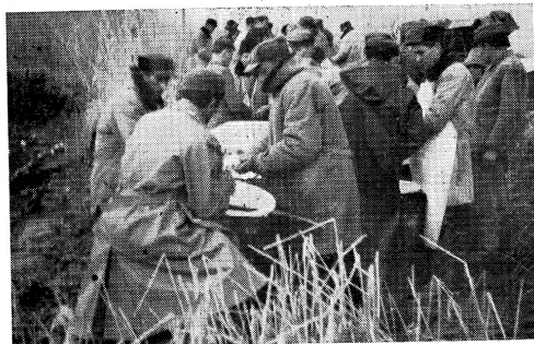
Cijepljenje na sortirnom stolu

vor, gdje je od 30 hiljada uzgojeno preko 1000 jednogodišnjaka, prosječne težine oko 300 grama. Najveći prirast su amuri postigli u oglednom ribnjačarstvu Ribarskog gazdinstva Beograd u Pančevačkom ritu — 370 grama, ali je tu od 30 hiljada komada ostalo nešto preko 100 komada. Naime, većina ličinaka je uginula tokom noći u klorisanjoj vodi u Zavodu za ribarstvo Ribarskog gazdinstva.