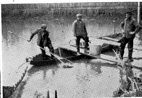
Izlov šarana i amura iz mreže

žinu oko 100 gr. To nam pokazuje da je prirast amura u Poljani izvrstan, daleko bolji nego šarana, i da je uspjeh tog uzgoja u prvoj godini jedan od najboljih. Doznali smo da je u Končanici uspjeh još bolji, tj. od 30 hiljada ličinaka je izlovljeno blizu 5000 komada jednogodišnjih amura, prosječne težine isto oko 260 grama. Još je dobar uspjeh uzgoja amura postignut u novom ribnjačarstvu Prnja-