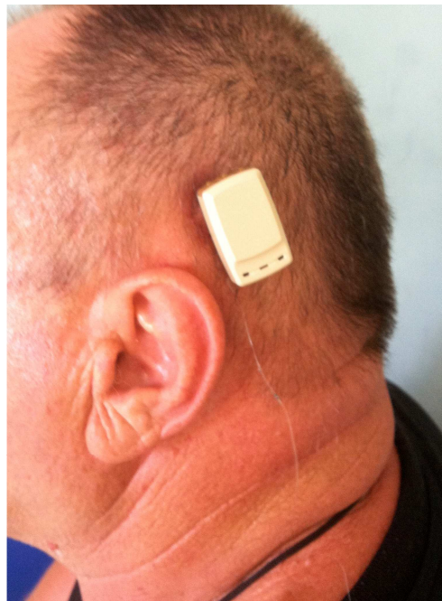
Slika 1. Uredan položaj titanijskoga implanta po završenom procesu osteintegracije (ugrađen BIA300 implant 4 mm w abutment 6 mm)