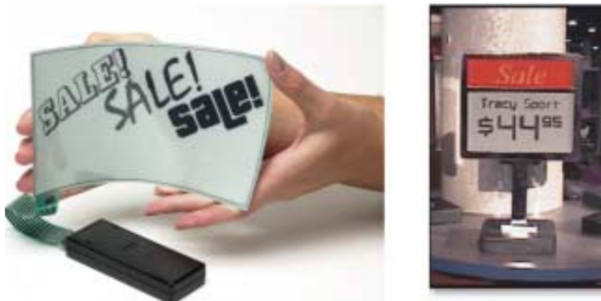
Bild 1: Elektronisches Papier und Verwendung als Werbeplakat

Die Technologien von E Ink und Gyricon basieren auf mikroskopisch kleinen, etwa haardünnen Kugeln, die in Abhängigkeit von der durch Elektroden erzeugten Ladung eine helle oder dunkle Ausprägung annehmen und in transparente Spezialfolien eingebettet sind. Die einzelnen Darstellungseinheiten bzw. ihre Elektroden lassen sich über einen Displaycontroller ansprechen. Während Gyricon für eine Darstellungseinheit eine Kugel verwendet, finden sich bei E Ink jeweils mehrere (siehe Bild 2). Detaillierte Informationen finden sich auf den Webseiten der Unternehmen (E Ink 2002 und Gyricon 2002) sowie bei Ditlea 2001 und Ditlea 2002. Forschungsarbeit wird u.a. noch im Bereich einer adäquaten Auflösung geleistet; E Ink arbeitet in Kooperation mit dem japani-