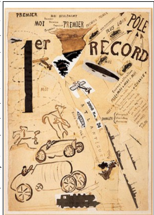
Abbildung 5: Die erste Ausgabe der Zeitschrift „Parole in Libertà“

So lautet die Forderung nach ständigem Bestreben nach Modernität im achten Punkt des ersten futuristischen Manifestes. Marinetti ging 1916 in „Italia futurista“ so weit, die neue „religione-morale della velocità“ 80 zu proklamieren. Mit den neuen Erfindungen und Entwicklungen an der Jahrhundertwende – wie dem Auto oder dem erste Flug der Gebrüder Wright 1903 – wurden die bisherigen Grenzen der Entfernung nahezu aufgehoben. Dazu trug auch das Radio bei, welches Informationen aus aller Welt in Realzeit übertragen konnte. Die Futuristen sahen in diese schneller werdenden Welt einen Wandel innerhalb der zeitgenössischen Wahrnehmung und somit der menschlichen Psyche. Waren früher die Nachrichten aus der eigenen Nation von Bedeutung, so lasen nun die Menschen in den Zeitungen über Aufstände in China und Ereignisse auf dem gesamten Globus; die Entfernungen schienen aufgehoben worden zu sein. Die neue „Velocità“ stellt für Marinetti eine Religion und gleichzeitig die Gottheit dar. Daraus folgt ein für den Futurismus typischer Einsatz von semantischen Oppositionspaaren, die als Katechismus der neuen Moral-Religion fungieren: