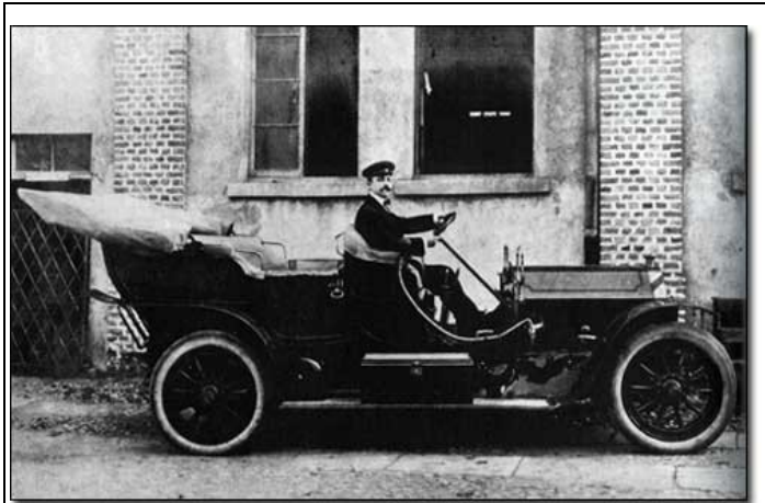
Abbildung 3: Marinetti und sein Auto um 1908

Neben dem „Ennuie“ 46 fingen die italienischen Künstler zunehmend an, sich von den Einflüssen aus anderen europäischen Staaten inspirieren zu lassen. So veröffentlichte Filippo Tommaso Marinetti 1909 das „Manifesto del Futurismo“ auf der Titelseite der Pariser Zeitung „Le Figaro“, die bürgerliche Zeitung Frankreichs schlechthin. Der Text stellt eine Mischung aus Poesie und Programmatik dar, ein „symbolisches Gedicht in Prosa“ 47 . Thema der Prosa ist ein nächtliches Treffen in Mailand, in dem Marinetti und seine Freunde bis zum Morgengrauen wach waren. Beim Sonnenaufgang fühlen sie sich schließlich wie wild aufgrund der Motorengeräusche auf der Straße und fahren sogleich mit ihren Autos davon. Es herrscht ein Gefühl der Euphorie und des Hochmutes vor während sie dem Tod hinterher jagen, die Autos stellen zugleich ihre „Bestien“ und „Geliebten“ dar, bis schließlich die Fahrt in einem Straßengraben endet, um zwei Radfahrern auszuweichen. Dieser Unfall stellt der Geburtsmythos des Futurismus dar, der damit endet, dass elf programmatische Punkte aufgelistet werden, von der Liebe zur Gefahr über die Verachtung der Frau bis hin zur Vergötterung des Kampfes und des Krieges als einzige „Hygiene auf der Welt“ 48 .