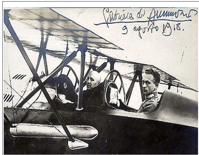
Abbildung 2: Gabriele D’Annunzio vor seinem berühmten Flug über Wien im Ersten Weltkrieg

Noch immer spürt man Anfang des 20. Jahrhunderts die Probleme der schnell aufholenden Industrialisierung in Italien. Kennzeichnende Faktoren waren die Agrarkrise ab 1890, die den Süden noch ärmer machte, die staatlichen Repressionen um die freie kapitalistische Entwicklung voranzubringen, dazu die konservative Regression, die vor-kapitalistische Werte propagierte, die mögliche Gefahr des Proletariats, sowie die Ablehnung des kapitalistischen Systems. 43 Hinzu kam die bereits vorhandene und nun zunehmende Kluft zwischen den Intellektuellen und dem Bürgertum, sowie der wachsende Konflikt zwischen Proletariern und Bürgern. Die herrschenden Eliten stellten das bisher erreichte in den Mittelpunkt, während die neuen Intellektuellen auf das ästhetische Sinn- und Innovationsvakuum hinwiesen. Dies hat den italienischen „Decadentismo“ zur Folge, der keinen Durchbruch schaffen will, wie die Scapigliatura, sondern die alten Kulturmuster lediglich erneuern kann, um das „Auseinanderreißen“ zu verhindern. Dabei stürzen sich Literaten und Poeten wie Gabriele D’Annunzio auf eine übersteigerte Romantik gegen den bisherigen Klassizismus. Vor allem bei ihm findet sich