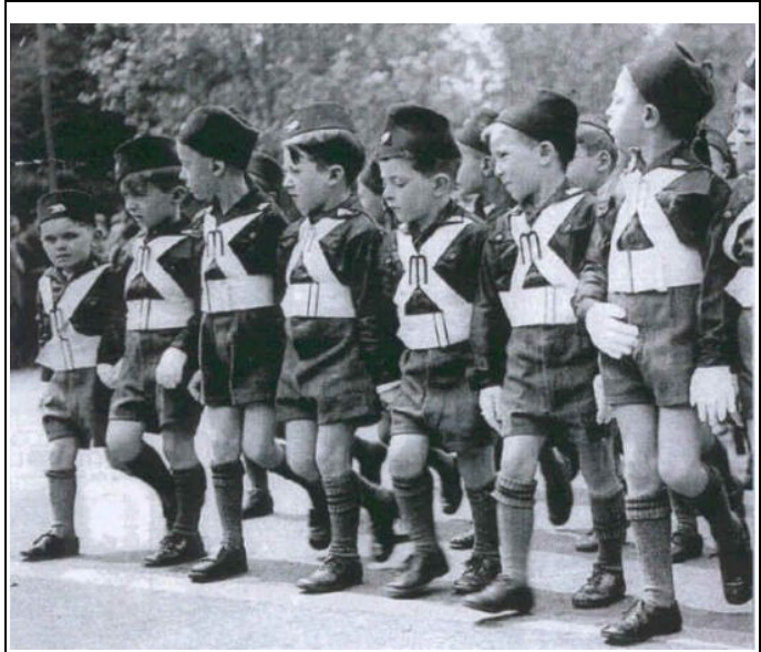
Abbildung 6: „Balilla“ – Mitglieder der faschistischen Jugendorganisation

Die 1932 erschienene „Dottrina del Fascismo“ versucht die verschiedene ideologischen