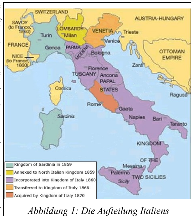
Abbildung 1: Die Aufteilung Italiens

Außenpolitisch war Italien noch keine Großmacht, obwohl die Anstrengungen auf militärischer Ebene über die bestehenden Möglichkeiten hinaus vorangetrieben wurden. Denn der Wunsch seitens der Regierungen, vorne auf dem europäischen Parkett mitzuspielen, war groß, was aber nach dem Aufstieg Preußens zur Vormacht Europas nach 1871 nicht gelang. Die Aufnahme in das Bündnis mit Österreich-Ungarn und Deutschland hatte nur zur Folge, dass man nunmehr das Gefühl hatte, anerkannt worden zu sein, und dass man sich auf der verzweifelten Suche nach Prestige in problematische Kolonialabenteuer stürzte. Ungeklärt blieben nur die italienische Ansprüche auf Gebiete wie Triest und Trient, welche noch zu Österreich gehörten und offiziell aufgegeben wurden, aber inoffiziell als „Terra irredenta“ galten. 14