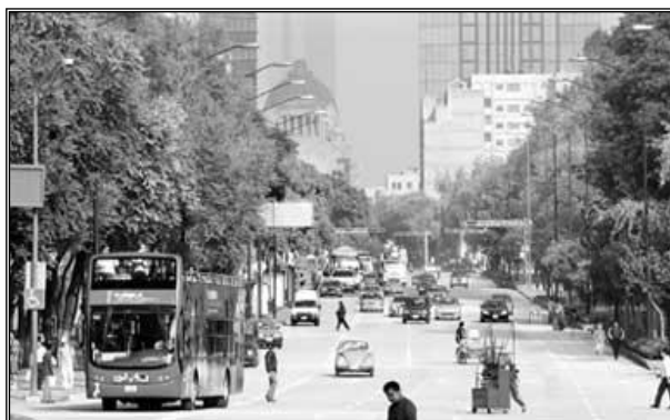
Foto 6. Avenida Juárez en la actualidad.