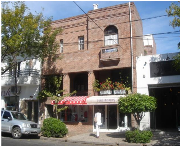
Foto 4. El comercio en Palermo Soho.