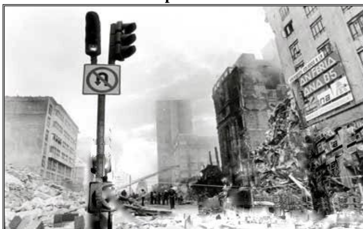
Fotografía 5. Avenida Juárez después del sismo de septiembre de 1985.

Autor: Modificado a partir de González, 2005