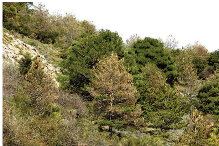
Figura 3. Incluso dentro de un mismo parche, basta con mezclar una especie de pino menos palatable ( Pinus pinaster ) con la susceptible ( Pinus nigra ) para que la defoliación del rodal disminuya. Pinar de la Cortijuela del Trevenque, Sierra Nevada, invierno de 2009.

También sabemos que diversificar el bosque añadiendo otras especies vegetales puede ofrecer recursos alternativos (alimento y otros hospedadores) a los parasitoides de la procesionaria ( Dulaurent et al. 2011b ), y que algunos hábitats son inadecuados para la pupación de las larvas, lo que reduce sus poblaciones ( Dulaurent et al. 2011a ). Además, otros depredadores como aves pueden verse favorecidos por un adecuado mosaico de hábitats ( Barbaro et al. 2008 , Barbaro y Battisti 2010 ). Por ejemplo, abrir claros supone en principio un entorno más favorable para la procesionaria, que prefiere los bordes de rodal para desarrollarse, pero si los claros no están desnudos sino cubiertos por matorral, son entornos inadecuados para la pupación ( Dulaurent et al. 2011a , Hódar et al. 2012b ) y además pueden favorecer la depredación de las puestas por ortópteros epigíridos ( López-Sebastián et al. 2004 , Hódar et al. 2012b ). Su condición de depredadores generalistas limita su capacidad para controlar a la plaga una vez su población se ha disparado, pero pueden jugar un importante papel en el mantenimiento de la procesionaria a densidades crónicas (p. ej. Klemola et al. 2002 ).