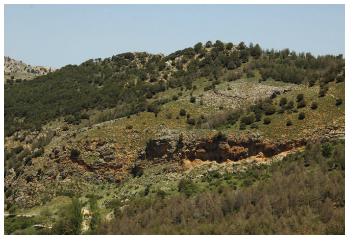
Figura 2. A pesar de las condiciones homogéneas en toda la loma, sólo los rodales de Pinus sylvestris y P. nigra (abajo, derecha) están defoliados, mientras que los de Pinus pinaster (arriba, izquierda) están intactos. Pinar de la Cortijuela del Trevenque, Sierra Nevada, invierno de 2010.

Y es que, en efecto, las características de una plaga encajan en general bastante bien con las de una enfermedad infecciosa. Cifrándonos al caso de la procesionaria, ya hemos visto su dependencia de las condiciones climáticas (puntos 4 y 5). Tiene una alta capacidad reproductiva (punto 3); la puesta promedio es de unos 200 huevos, lo que le permite incrementar su población en dos órdenes de magnitud de un año para otro. También el punto 1 es bastante claro: aunque casi todos los pinos son en cierto grado susceptibles a la procesionaria, las grandes defoliaciones se dan en hospedadores susceptibles, como el pino albar o el salgareño cuando las condiciones son adecuadas (Fig. 2), o de forma crónica en pinos exóticos muy palatables como el canario ( Pinus canariensis ) o el pino de Monterrey ( P. radiata , Cobos-Suárez y Ruiz-Urres-tarazu 1990). Esto también puede explicar por qué extensas zonas de pinares en tierras bajas y cálidas, como Doñana (con P. pinea ) y la costa mediterránea (con P. halepensis ) no son sistemáticamente defoliadas todos los años, pese a su bonanza térmica invernal para la procesionaria (Hódar et al. 2012a). Por otra