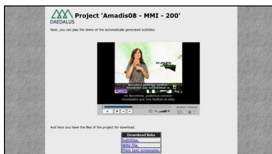
Figura 3: Interfaz de salida con demostrador de los subtítulos generados

generados), y permite la descarga de los archivos de subtítulo en distintos formatos.