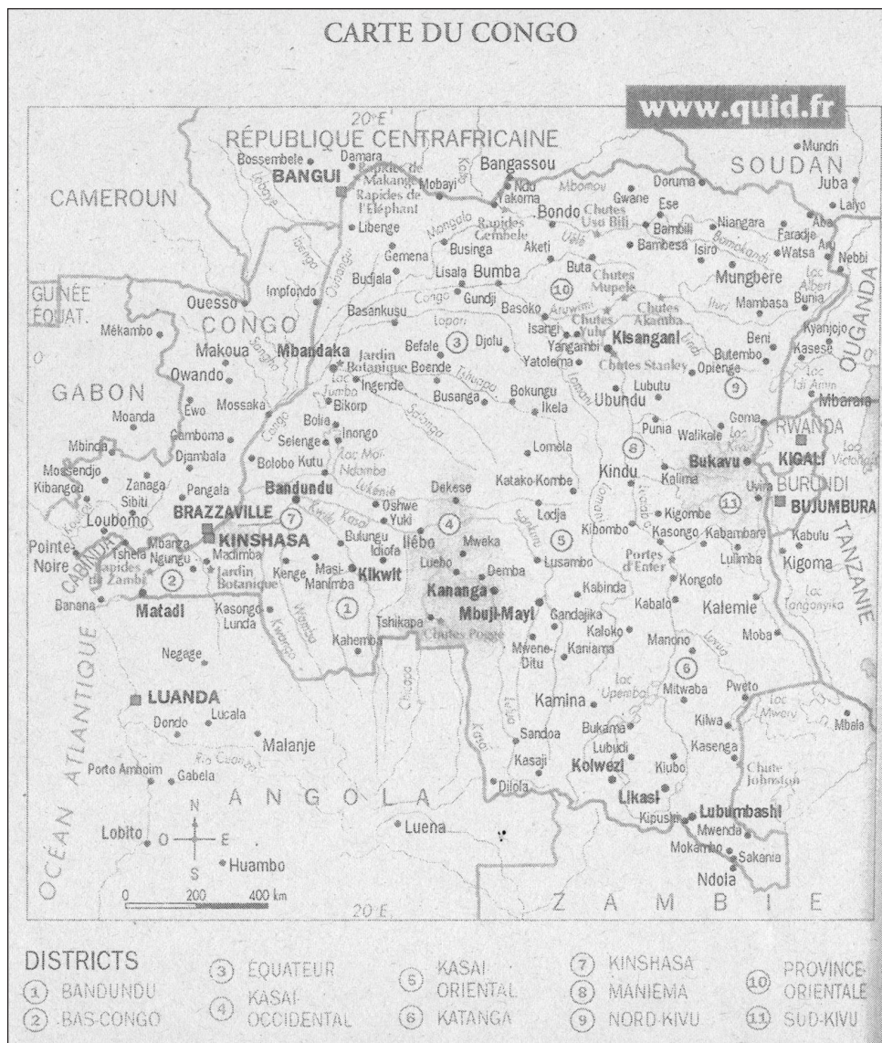
FIGURA 1. Mapa de la República Democrática del Congo.