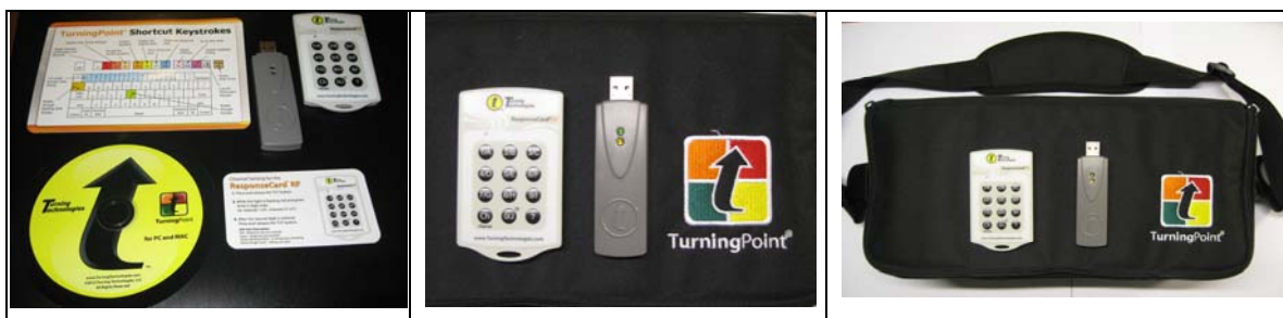
Figura 2. Dispositivos emisores y receptor del sistema de votación por RF.

Otra novedad de este curso ha sido el formato de wiki para la realización de las monografías, utilizándose el módulo wiki de Moodle. Con este formato de presentación de los trabajos, el resto de compañeros puede evaluar el trabajo realizado por cada grupo en un tiempo no presencial, utilizando una rúbrica para calificar ciertos aspectos de las wikis. Cuando se reúne al curso para la realización de las encuestas evaluadoras