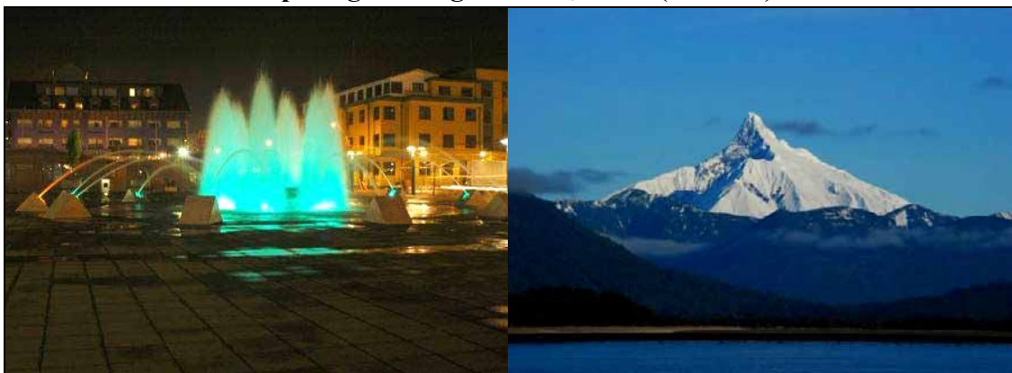
Figura 2. Paisaje urbano contemporáneo: Puerto Montt, Chile (izquierda). Paisaje natural protegido: Lago Yelcho, Chile (derecha)