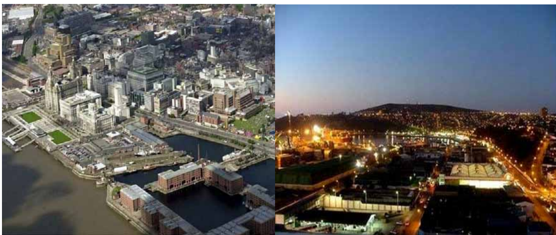
Figura 3. Diferentes paisajes urbanos: Liverpool, Inglaterra (izquierda), Concepción, Chile (derecha).