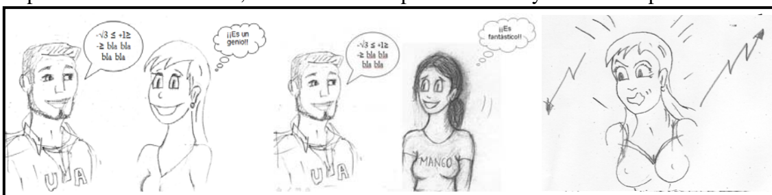
Figura 1. Presentación de los personajes y contextualización.

El propósito de esta primera sección de la CT es motivar al estudiante para que, implicándose en la historia, se esfuerce en la pronunciación y resuelva la prueba final.