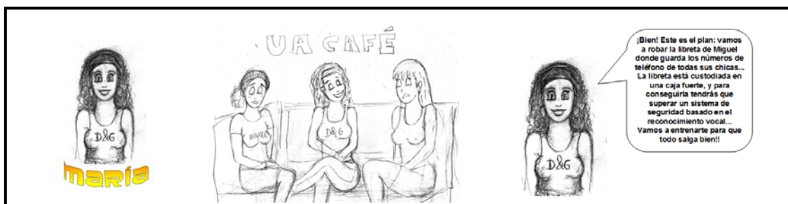
Figura 2. El personaje de María.

En esta primera parte se introduce también el personaje de María, una chica (personaje tutor) que guiará a los alumnos a lo largo de la CT, dándoles consejos e instrucciones para realizar las actividades de pronunciación correctamente.