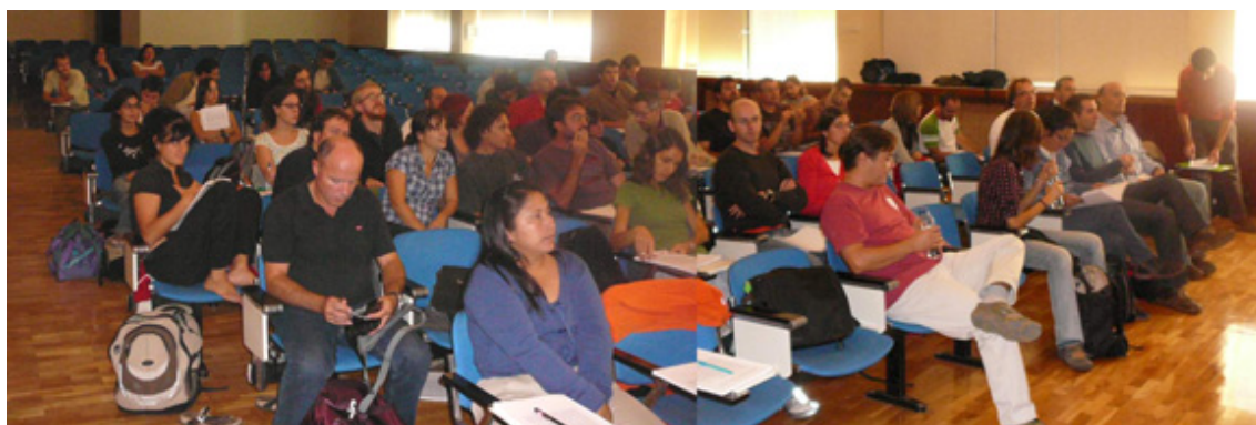
Figura 1. Vista de los asistentes a la reunión de trabajo.

Bajo el lema "Análisis Espacial en Ecología: Métodos y Aplicaciones", se celebró entre los días 24 y 26 de septiembre de 2008 en la Escuela Universitaria de Ingeniería Técnica Agrícola de la Universidad Politécnica de Madrid la segunda reunión de trabajo del Grupo de Ecología Espacial de la AEET (ECESPA), organizada por los que esto escriben en colaboración con miembros de ECESPA y la Asociación Española de Ecología Terrestre (AEET). Esta reunión congregó a más de 60 estudiantes, investigadores, profesores de universidad y técnicos de la administración llegados de toda la geografía española. Al igual que en la reunión anterior, celebrada en 2006, las sesiones incluyeron ponencias invitadas y comunicaciones de los asistentes, tanto orales como pósteres. En total se presentaron cuatro ponencias invitadas, dieciocho comunicaciones orales cortas y trece pósteres ( Fig. 1 ).