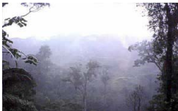
Foto 1.- El bosque mesófilo de montaña de El Rincón, Sierra Norte, Oaxaca, México.

Las áreas montañosas húmedas tropicales y subtropicales del planeta en regiones frecuentemente cubiertas por nubes forman un tipo de vegetación denominado bosque mesófilo de montaña. El dosel de éste tipo de vegetación tiene una altura media (12- 18 m) más baja que el del bosque tropical lluvioso y, en comparación con éste último, se ubica, por lo general, en un piso altitudinal más alto. La mayor parte de las especies de árboles y arbustos del bosque mesófilo de montaña presentan hojas esclerófilas y abundancia de epífitas. En el piso forestal, los suelos son húmedos con alto contenido de materia