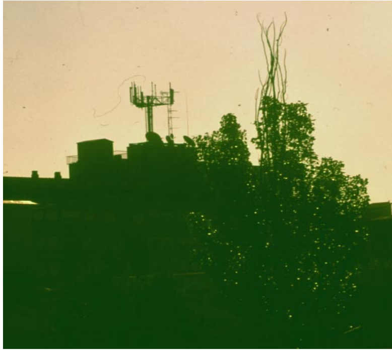
Figura 2. Álamo ornamental expuesto a una intensidad de Campo eléctrico de más de 2 V/m de forma continua. Nótese que las radiaciones afectan especialmente a la copa del árbol que podría actuar como una antena receptora.