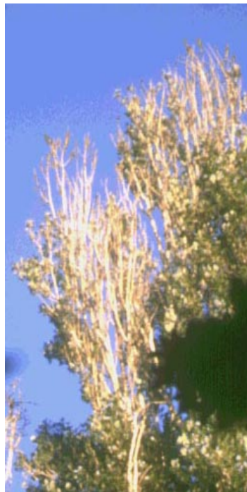
Figura 3. Chopos del Parque Urbano del 'Campo Grande' (Valladolid) que empezaron a secarse a partir de la instalación de varias estaciones base a unos 100 metros de distancia.