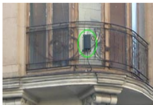
Figura 5. Pequeñas antenas emisoras (pico-antenas) que se están instalando en las ciudades de forma clandestina camufladas con el entorno. Su radiación incide directamente sobre los seres vivos de la ciudad.

En la actualidad las legislaciones son tan diferentes entre países que para una antena con una potencia de transmisión superior a 80 vatios la distancia de seguridad es de 10 metros en España y de 100 metros en Suiza (Baldauf et al. , 2002). Las diferentes normativas entre países, con niveles de protección bastante alejados, demuestran esta afirmación de un modo bastante contundente: Para el sistema GSM (900 MHz.), España admite hasta 450 \mu\text{w}/\text{cm}^2 ; Hungría, Bulgaria, Polonia e Italia hasta 10. China hasta 6,6. Rusia, Suiza, Luxemburgo y Valonia (Bélgica) hasta 2,4. Salzburgo (Austria) hasta 0,1 y Nueva Gales del Sur (Nueva Zelanda) hasta 0,001.