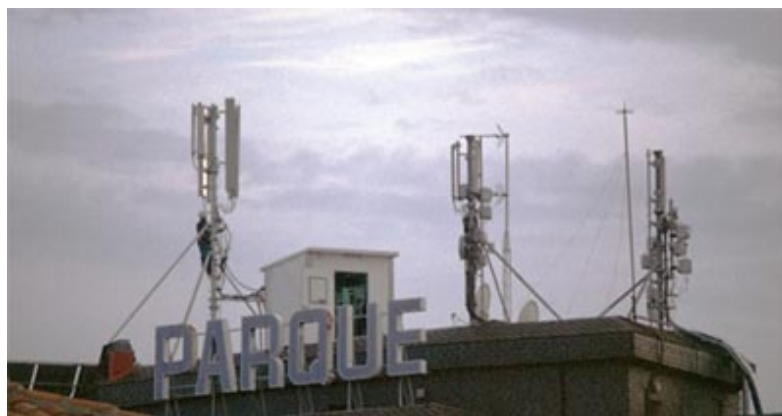
Figura 4. Estaciones base de telefonía sobre el tejado de un edificio. En los dos mástiles de la derecha pueden observarse radioenlaces. El operario encaramado en el mástil de la izquierda está montando el nuevo sistema UMTS.

Hace 15 años Wolfgang Volkrodt escribía, con algo de candidez, que en el siglo XXI se instalaría la fibra óptica, por lo que se dejaría de dañar el medio ambiente con peligrosas radiaciones electromagnéticas de microondas, al mismo tiempo que hacía un llamamiento sobre la urgencia de abandonar el uso de esta tecnología (Volkrodt, 1988). Sus previsiones, aunque bien intencionadas, no pudieron ser más equivocadas. Paralelamente a la fibra óptica la expansión de las comunicaciones sin cable ¿wireless? (GSM, DCS, UMTS, WLAN, WIFI, DECT, BLUE TOOTH?), en los últimos años, ha sido explosiva ( Fig. 4 y 5 ). De forma bastante menos inocente, ya advertía entonces el mismo autor, sobre los poderosos intereses de la industria y de sus intentos para evitar a toda costa que se investigase (Volkrodt, 1991). Otras veces la industria financió los estudios para después impedir su publicación (Hans-U. Jakob. datos no publicados).