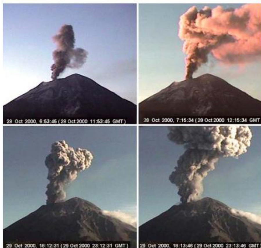
Figura 3. Actividad del volcán Popocatépetl durante el año 2000, uno de los períodos más activos.

El estudio de exposición a la inhalación de la ceniza volcánica procedente del Monte Santa Helena, a un grupo de hámsters (dos horas diarias durante un año), permitió detectar cambios en la función pulmonar y en la arquitectura del tejido de los animales, caracterizado por alveolitis y áreas con fibrosis, y a nivel traqueal, reducción en la actividad ciliar y cambios citomorfológicos. Así mismo, se observó la llegada de neutrófilos que regulan la adhesión local de moléculas, induciendo quimiotaxis de células inflamatorias en las vías aéreas (Schiff et al. , 1981; Raub et al. , 1985; Graham et al. , 1985). La exposición a la inhalación de ceniza en hámsters, proveniente de la actividad del volcán Popocatépetl ( Fig. 3 ), provocó una reacción inflamatoria aguda y crónica, foco neumónico con detritus celulares e infiltración de linfocitos en el tejido pulmonar (Rivera et al. , 2003).