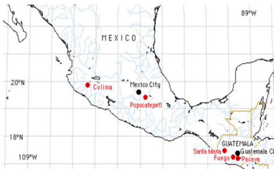
Figura 2. Mapa que muestra las zonas geográficas de actividad volcánica en México, durante los últimos años, volcán de Colima y volcán Popocatepetl.

México alberga a 22 de los 300 volcanes activos del mundo que, junto con Centroamérica y la zona andina, constituyen las regiones geográficas con mayor actividad volcánica en el mundo. En México han sido trece los volcanes que han producido erupciones en tiempos históricos, actividad originada por la dinámica en la zona de subducción del Pacífico, las fallas Montagua-Polochic, la falla Rivera y la reactivación de la falla que de este a oeste configura el Eje Neovolcánico Transmexicano (Plan de contingencias del volcán Popocatepetl, Puebla 1995).