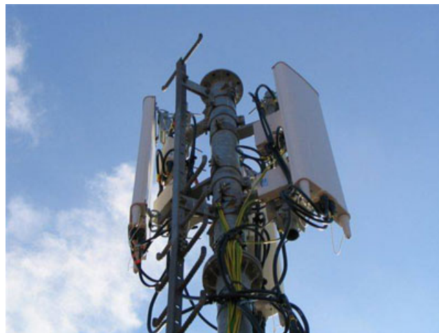
Figura 1. Primer plano de una estación base de telefonía móvil.

Desde la segunda mitad de los años 90 del pasado siglo se ha realizado el despliegue de la red de estaciones base de telefonía, que ha incrementado en varios órdenes de magnitud la contaminación electromagnética por microondas, especialmente en las ciudades, pero también en el campo, cerca de los núcleos rurales y las infraestructuras viarias. La intensidad de campo eléctrico en un punto concreto en las proximidades de una antena varía continuamente entre ciertos niveles, dependiendo del número de comunicaciones que soporta la estación base (número de móviles conectados en cada momento) ( Fig. 1 y Fig. 3 ). Existen continuamente cambios de la intensidad y la frecuencia en las señales GSM que les hace más bioactivas que los campos con parámetros constantes, posiblemente porque es muy difícil para los organismos vivos adaptarse a ellas, lo que puede hacer la vida en sus proximidades complicada (Panagopoulos et al. , 2004).