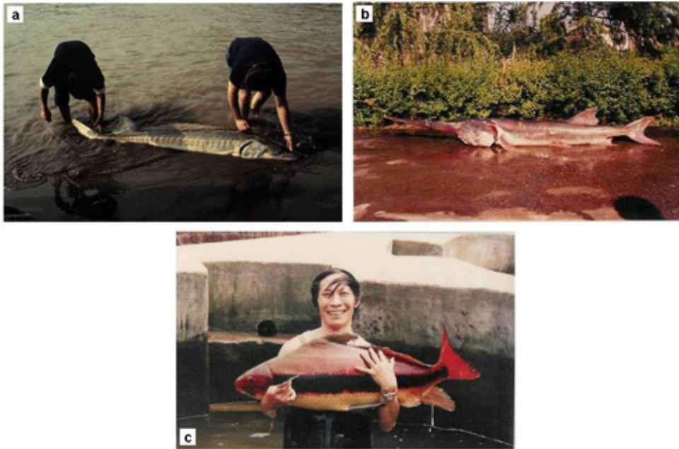
Figura 4. Especies de peces migratorios amenazadas por la presa de las Tres Gargantas: a) el esturión chino ( Acipenser sinensis ) (foto: Boyd Kynard); b) el pez espátula chino ( Psephurus gladius ) (foto: Steven D. Mims) y c) el pez chupador chino ( Myxocyprinus asiaticus ) (foto: Steven D. Mims).

declinaciones en las poblaciones de tres especies de peces endémicas, relictas y protegidas a nivel estatal, debido a la fragmentación de sus poblaciones y a la interrupción de las vías migratorias a sus lugares originales de desove: el llamado esturión chino ( Acipenser sinensis ; Fig. 4 ), el esturión del Yangtzé ( A. dabryanus ) y el pez espátula chino ( Psephurus gladius ; Fig. 4 ), una de las dos únicas especies de pez espátula del mundo. La presa de las Tres Gargantas representará una nueva barrera para la migración de estos peces, junto a cambios adicionales en el caudal de agua y en los patrones de sedimentación, lo que en su conjunto disminuirá todavía más las escasas posibilidades de supervivencia de estos taxones relictos (Wei et al. , 1997; Zhuang et al. , 1997; Xie P., 2003; Zhang S.-M. et al. , 2003). La presa también podría afectar a otra de las especies emblemáticas del río Yangtzé, el pez chupador chino ( Myxocyprinus asiaticus , Fig. 4 ), que ya sufrió una severa declinación de sus poblaciones con la construcción de la presa de Gezhouba (Dudgeon, 2000), y a las célebres “cuatro carpas chinas” ( Mylopharyngodon piceus , Ctenopharyngodon idellus , Hypophthalmichthys molitrix y Aristichthys nobilis ) y otras especies de interés comercial (CAS, 1990; Park et al. , 2003).