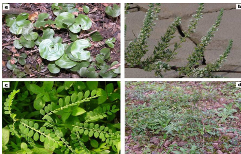
Figura 3. Taxones vegetales endémicos y/o amenazados por la construcción de la Presa de las Tres Gargantas: a) Adiantum reniforme var. sinense (foto: Jiang Mingxi); b) Myricaria laxiflora (foto: Xie Zongqiang); c) Securinega wuxiensis (foto: Ren Mingxun); y d) Chuanminshen violaceum (foto: Jiang Mingxi).

Afortunadamente, la administración china está llevando a cabo toda una batería de medidas encaminadas a la adecuada