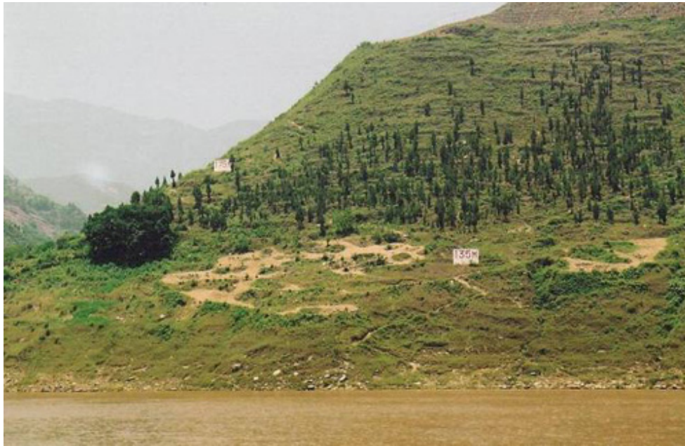
Figura 2. Terrenos erosionados en el área del embalse de las Tres Gargantas.