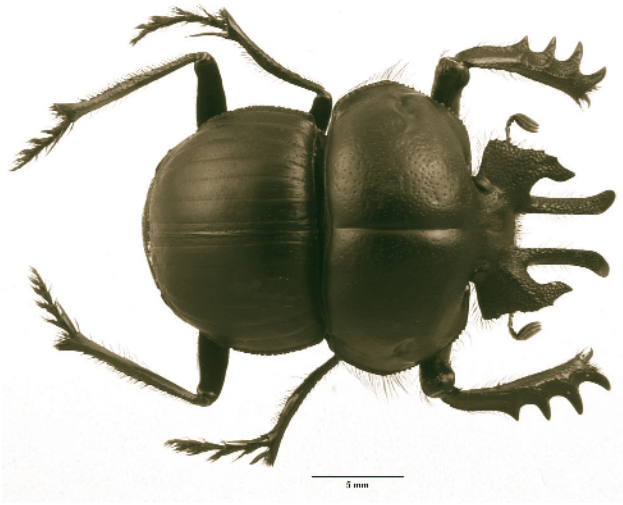
Figura 4. Anomiopsoides nueva especie recientemente descubierta; el género es endémico de la provincia biogeográfica del Monte.

funcionamiento de los ecosistemas, raramente estos son considerados cuando se toman decisiones sobre conservación de la biodiversidad. Una de las razones por las cuales los insectos no son generalmente considerados a la hora de determinar o administrar las áreas protegidas, es el relativamente escaso conocimiento que se tiene de ellos. Las áreas protegidas del Sur de América del Sur cuentan únicamente con listas de especies y éstas son muy incompletas y no hacen mención de la historia natural de las especies de insectos.