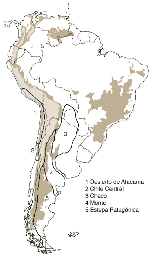
Figura 1. Áreas áridas del sur de América del Sur.

Ciertos grupos de scarabaeoideos son característicos de zonas áridas y se los encuentra en ambientes semidesérticos o desérticos en varias regiones del planeta, por ejemplo Glaresidae y Ochodaeidae.