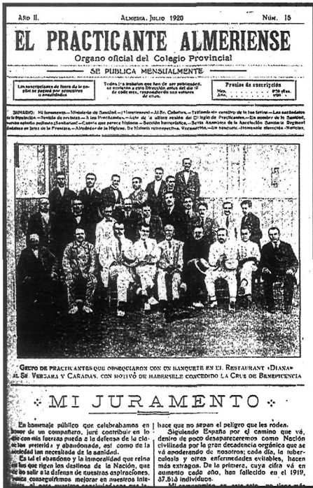
Portada del número 15 de la publicación correspondiente a julio de 1920

Complejo Hospitalario Torrecárdenas. Paraje Torrecárdenas S/ N° - O4009- ALMERÍA