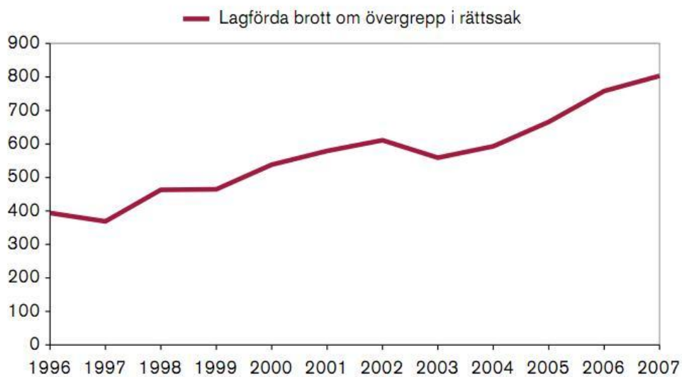
Figur 2. Antal lagförda brott för övergrepp i rättssak. År: 1996-2007. 95