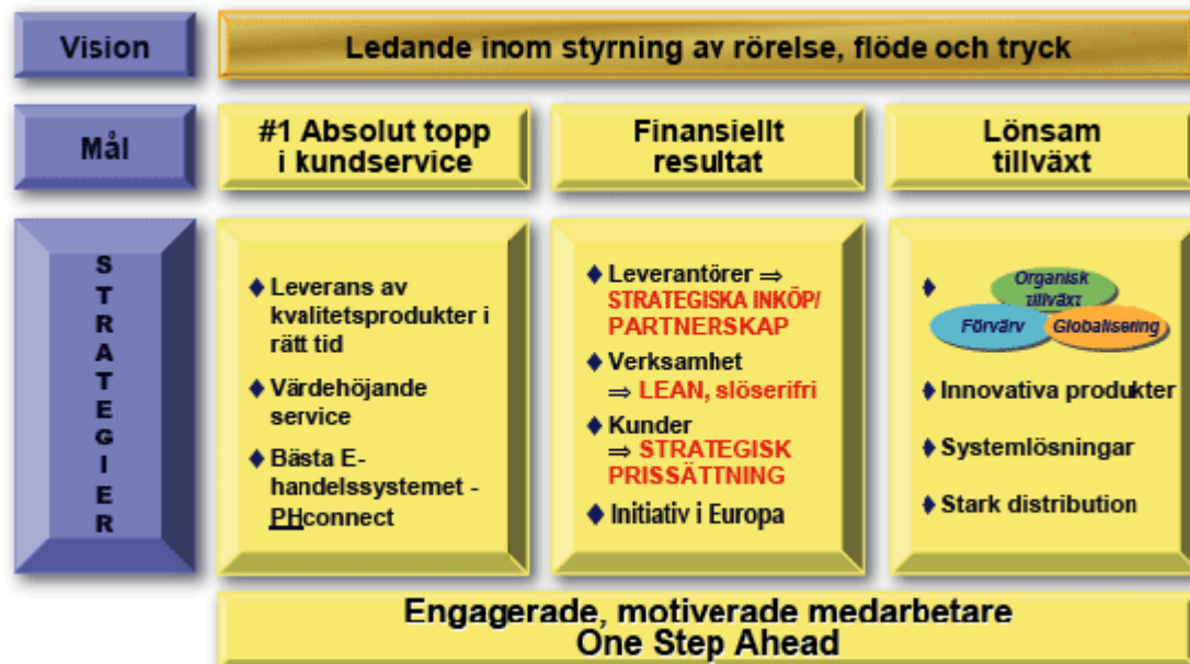
Figur 4.2: The Win Strategy 79

År 2001 fick Parker en ny CEO som förvisso hade sin bakgrund inom företaget. Han såg dock en problematik där företaget var relativt splittrat, mycket på grund av att det hade vuxit kraftigt genom många förvärv. Följden av detta var att det upplevdes att Parker hade flera företag i ett, vilket bland annat tog sig i uttryck med olika mål. För att komma tillrätta med denna splittring lanserade han något som kallades för "The Win Strategy".