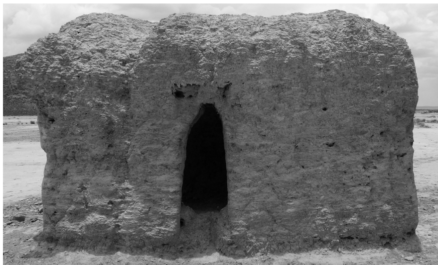
3. kép Vályogtéglából emelt chullpa , Anocariri, Oruro, Bolívia

elfoglaló chiribaya kultúra, ahonnan nagy számban ismertek természetes úton kiszáradt emberi, lámaféle- és kutyamúmiák. A mintegy 500 természetes úton mumifikálódott emberi múmia mellett a kutatók egy kis csoport mesterséges múmiát is azonosítottak. Ezek hasán a hasüreg kiürítése céljából hosszú vágásokat ejtettek. A gondosan megtisztított hasüreget nyers gyapjúval tömték ki, továbbá kukoricát, édesburgonyát és kokaleveleket helyeztek bele; egy idős férfi mellkasi üregében pedig egyenesen egy kokalevelekkel megtöltött kis edényre bukkantak. Ezt az eljárást követően a hasat gyapjúfonallal összevarrták, és a testeket halotti lepelbe tekerték. A testek többségénél kimutatható volt, hogy a halotti leplet cserélték, egy 30 év körüli női halott esetében pedig az volt megfigyelhető, hogy a koponya felső része kifehéredett és kalcinálódott, ellentétben a test többi részével, ami arra utal, hogy legalábbis a test egy részét napsütés érte. Arra egyelőre nincs magyarázat, hogy egyes halottak miért részesültek ilyen bánásmódban, de egyértelmű, hogy valamilyen élők által gyakorolt rítusban vettek részt, míg másokat gyorsan eltemettek. 8