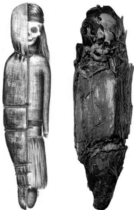
1. kép Chincorro múmia

E múmiák felfedezése ugyanahhoz a német Max Uhléhoz (1856–1944) köthető, aki annyi más andesi régészeti kultúrát azonosított, és méltán nevezik a perui régészet atyjának. Elsőként felfedezett lelőhelye után ő nevezte el aricai őslakóknak az egykor ott eltemetett embereket. Ugyancsak tőle származik a chincorro kultúra vagy hagyomány elnevezés, 1 ami a sírokban talált apró hal tartó szatyrok spanyol elnevezésére utal. Uhle tizenegy teljes és egy részleges múmiát publikált 1922-ben. 2