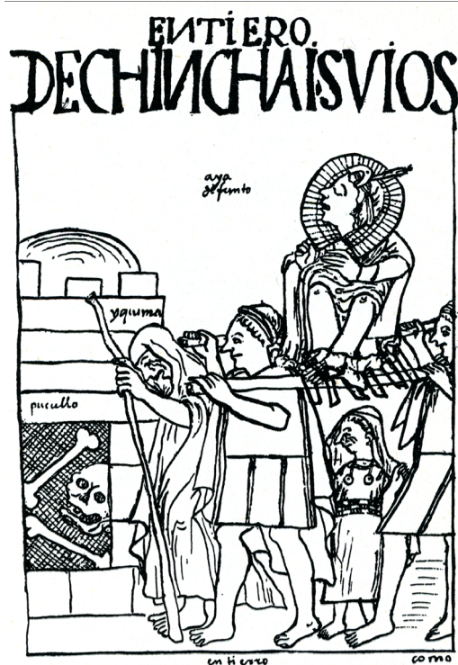
4. kép Inka királyi múmia szállítás közben

(Felipe Guaman Poma de Ayala, Nueva corónica y buen gobierno . I. Hely és év nélkül, 205. ( http://www.latinamericanstudies.org/incas/Nueva_coronica_1.pdf )