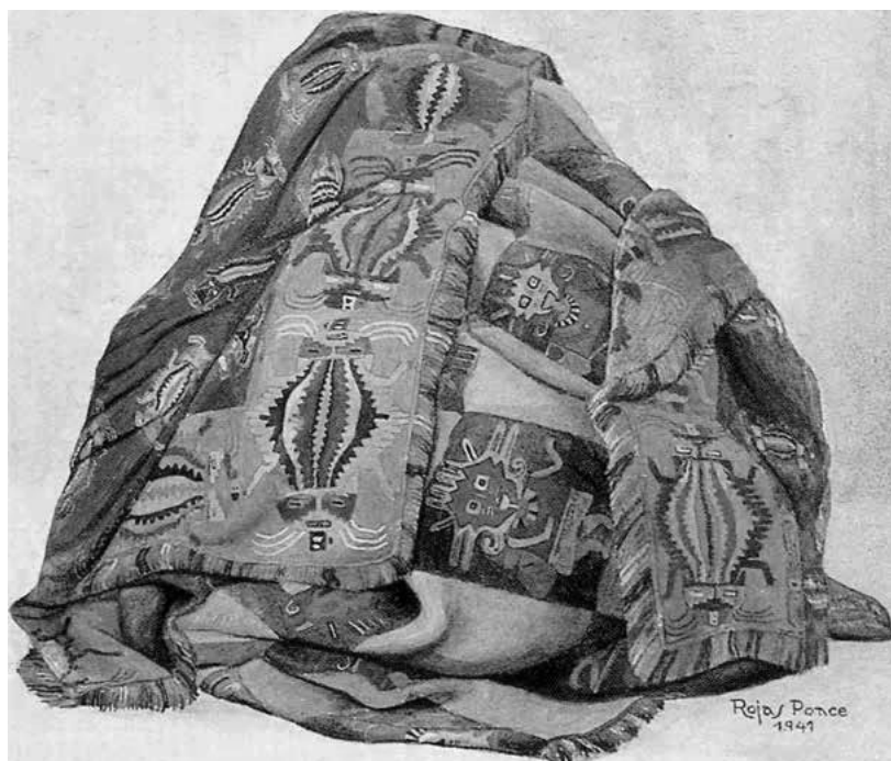
2. kép A paracasi 310. számú múmiaköteg