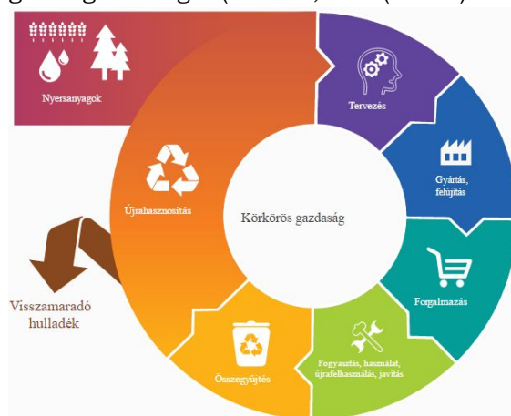
1. ábra. Körforgásos gazdaság (Vadász, NZs (szerk.) 2016)

2015. év végén az Európai Bizottság elfogadta a körforgásos gazdasággá alakulást elősegíteni hivatott dokumentumcsomagot. Ez arra ösztönzi a vállalatokat és a fogyasztókat, hogy az erőforrások felhasználása gazdaságosabban történjék. A körforgásos gazdaság felismeri, hogy a környezetterhelés számos esetben nem csökkenthető csupán egyetlen termelési folyamaton belül, mert elkerülhetetlenül keletkezik hulladék. Ezért a termelési, fogyasztási és hulladékkeletkezési folyamatokat össze kell kapcsolni, és a természetben eleve meglévő körforgást kell az iparban is megvalósítani. Az ipari szimbiózist kell előmozdítani, vagyis az egyik ágazat hulladékát egy másik ágazatban nyersanyagként hasznosítani (IETC 2015; EB 2014). Az 1. ábra szemlélteti a körforgásos gazdaságot (Vadász, NZs (szerk.) 2016).