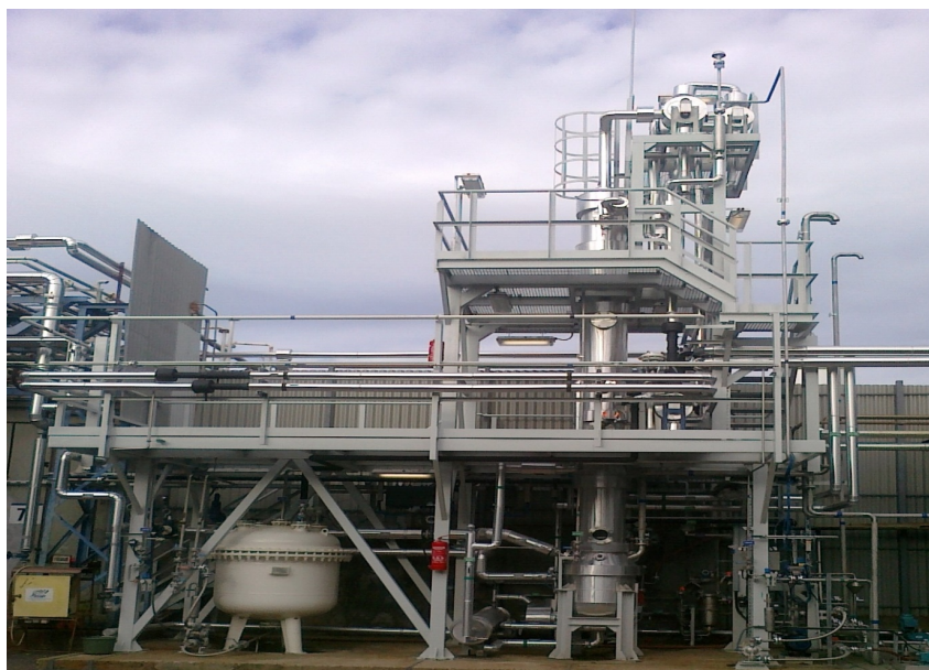
4. ábra. A diklórmetánt eltávolító ipari méretű kolonna (Tóth, AJ 2015; Tóth, AJ & Mizsey, P 2015)

A kolonna jelenleg messze az elvárások felett teljesít. Kisebb refluxarányval üzemel, mint a félüzemi kísérletek során, ami jelentős gőzmegtakarítást eredményez. A kolonna fenéktermékében a kimutathatósági határ alá került a diklórmetán. A desztillátumból egyszerű fáziszeperációval nyerhető ki a tiszta diklórmetán, amelyet az üzemben lehet újrahasznosítani.