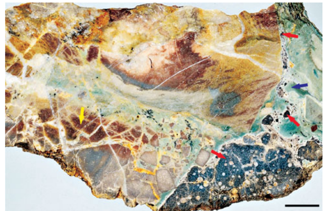
1. ábra – Peperit és hidraulikus breccsa. Piros nyíl: alsó-kréta alkálbazalt; kék nyíl: kimmeridge-i mészkő; sárga nyíl: oxfordi mészkő. K-Mecsek, Vár-völgy, Iharos-kút. Méretarány: 6 mm

A Vár völgyi Iharos-kúttal szemközti domboldalon, a Somosi-patak és a Vár völgyi patak találkozásánál lévő Földtani ismertető-táblánál vörös, tűzköves oxfordi mészkő ( Fonyászi Mészkő Formáció ) és zöldesszürke kimmeridgei mészkő ( Kisújbányai Mészkő Formáció ) tárul fel (Nagy, 1986). A zöldesszínű mészkőben 100 cm-től több cm-es nagyságig találhatóak bazalt fragmentumok, melyek túlnyomó többsége erősen hólyagüreges, üveges megjelenésű. A hólyagüregeket kalcit és klorit tölti ki. A kalcittal kitöltött hólyagüregek sok helyen egymásba is nyílnak. A kisebb bazaltos klasztok tagolt, éles-tarajú hólyagüreges szemcsék, hólyagüreg-fal töredékek, palagonitosodott üvegszilánkok és kalcithólyagüreges üvegszilánkok. A magmás kőzetdaraboknak a zöld-színű mészkővel való érintkezése mentén a mészkő vékony sávban kifehéredett. Némely részén a mészkőnek a laza mészszipba nyomuló bazalt áramló mozgására utaló szövet látható ( 1. ábra ), mely fluidális peperitnek minősíthető. A zöld színű mészkőben a karbonátos anyag szintén kaotikus áramlási jellege figyelhető