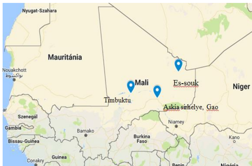
3. ábra Észak-Mali kulturális világörökségi és világörökségi várományos helyszínei (saját szerkesztés)

Mali 1977-ben csatlakozott a Világörökség, 2012-ben pedig az 1954-es Hágai Egyezményhez. 31 Az ország északi fele két kulturális világörökségi helyszínt foglal magában: egyrészt Timbuktu mauzóleumait és mecseteit, másrészt pedig Gaoban Askia síremlékét, illetve egy várományos helyszínt, Es-souk régészeti lelőhelyét (3. ábra). 32 Az UNESCO a Szükségalapot és a Világörökségi Alapot is mozgósította preventív intézkedések megtétele céljából, emellett topográfiai adatokat és tájékoztatókat biztosított a katonai erők számára a kulturális javak védelme érdekében. Timbuktu 2012. június 28-án felkerült a Veszélyben levő Világörökség Jegyzékébe. Emellett az ENSZ BT is több határozatban hívta fel a figyelmet az örökség védelmére, 33 de a borzalmak mindezek ellenére megtörténtek. Az elkövetők felkutatása és felelősségre vonása pedig a konfliktus rendezésének fontos részét képezi.