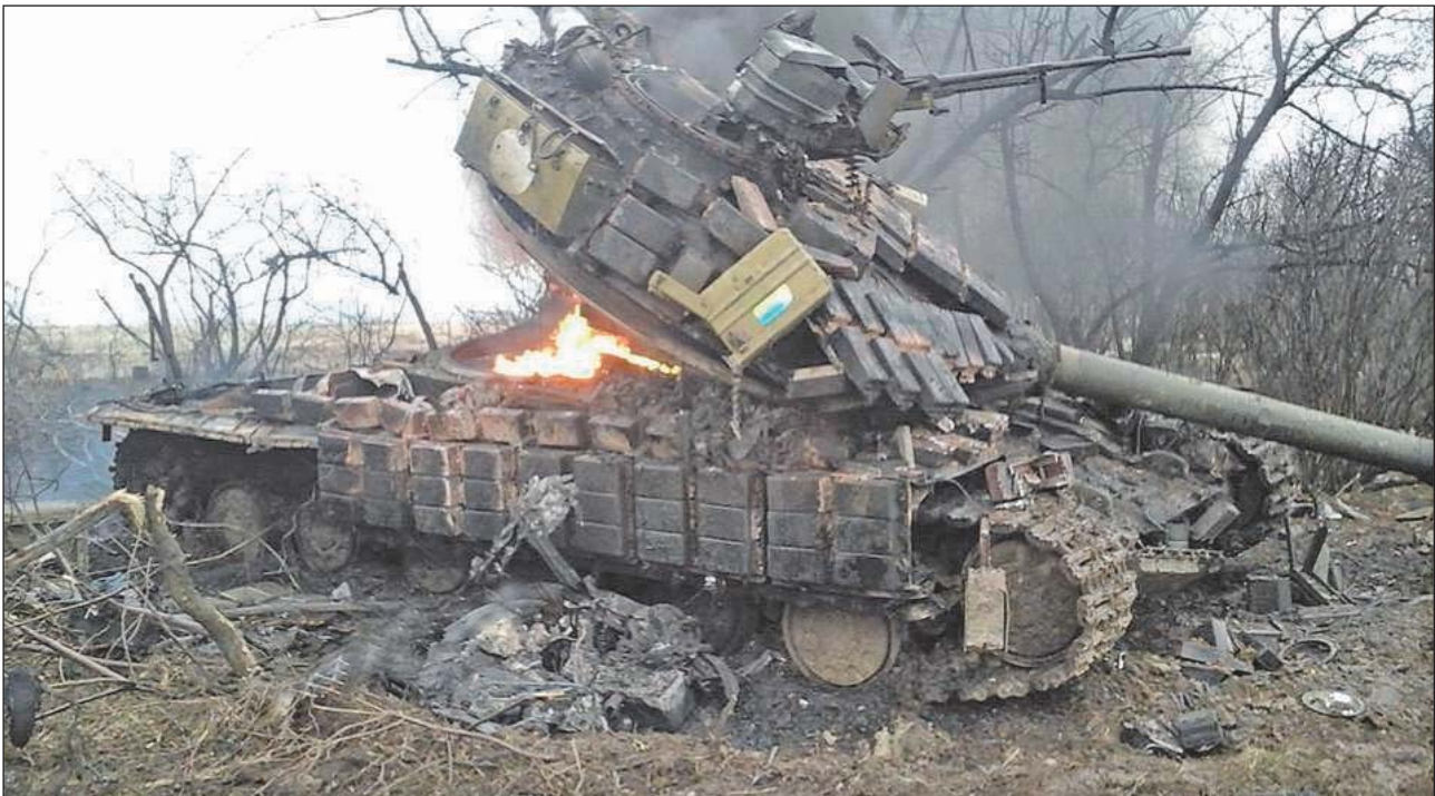
2. ábra. Az ukrajnai harcok során kilőtt T-64-es a reaktív páncélzat jellegzetes tégláival

tén a tüzérség az ellenséges védművek és a gyalogság pusztítására alkalmas lőszerrel, repesz-romboló gránátokkal tüzelt [6., 18. o.], méghozzá elég nagy távolságból, hogy az ellenséges tüzérségi tűz őket lehetőleg már ne érhesse el. Miután a harckocsik kezelőszemélyzete biztonságban volt a gránátok repeszhatásától is, így igazából csak egy kellően nagy űrméretű fegyverből leadott közvetlen találat volt képes biztosan elpusztítani őket, amihez viszont az ágyúkat előre kellett vonni az első vonalba.