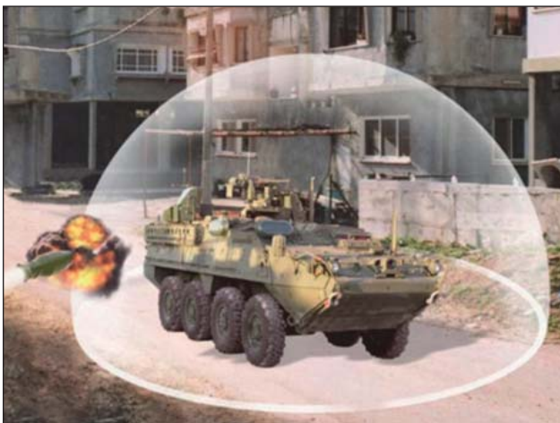
1. ábra. Egy grafikus ábrázolás az APS működéséről

sel párhuzamosan) jelentősen csökkentette a páncélosaink számát az utóbbi időben [4.]. Azonban feltételezhető, hogy az ilyen lépések mögött a békeidőben óhatatlan költségcsökkentési megfontolások állnak csupán, és valójában egyetlen korszerű hadsereg sem engedheti meg magának a harckocsik teljes mellőzését.